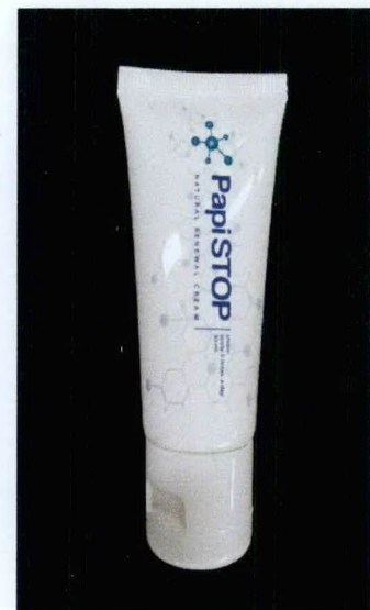
PapiSTOP Natural Renewal Cream 30 mL (na may therapeutic claims)