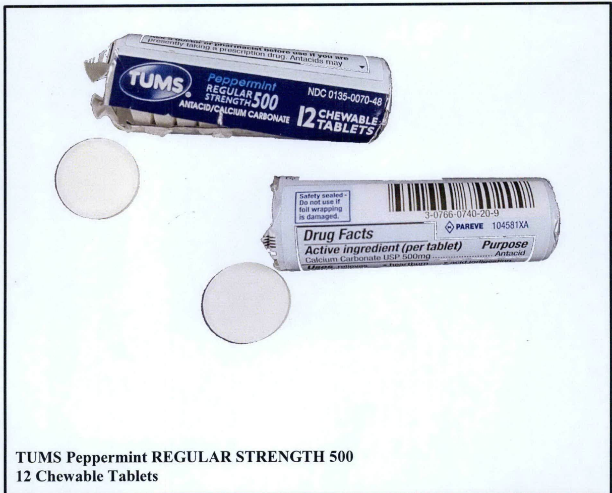
TUMS Peppermint REGULAR STRENGTH 500 12 Chewable Tablets

Pinapayuhan ng Food and Drug Administration (FDA) ang publiko laban sa pagbili at paggamit ng mga hindi rehistradong gamot na: