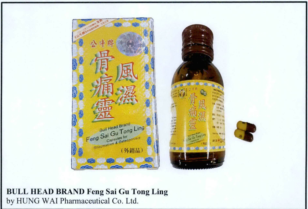
Larawan 3. Hindi rehistradong gamot