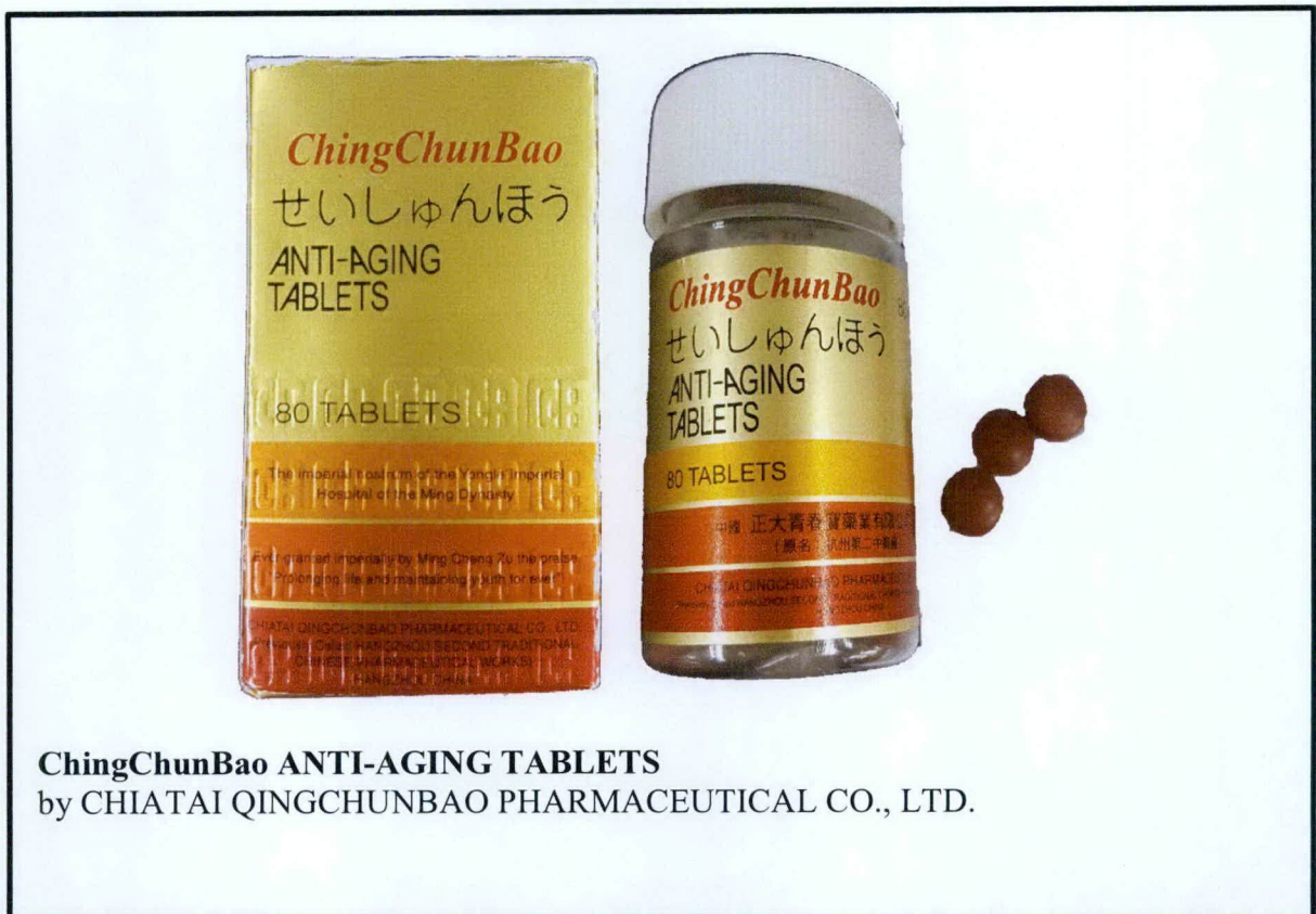
ChingChunBao ANTI-AGING TABLETS by CHIATAI QINGCHUNBAO PHARMACEUTICAL CO., LTD.