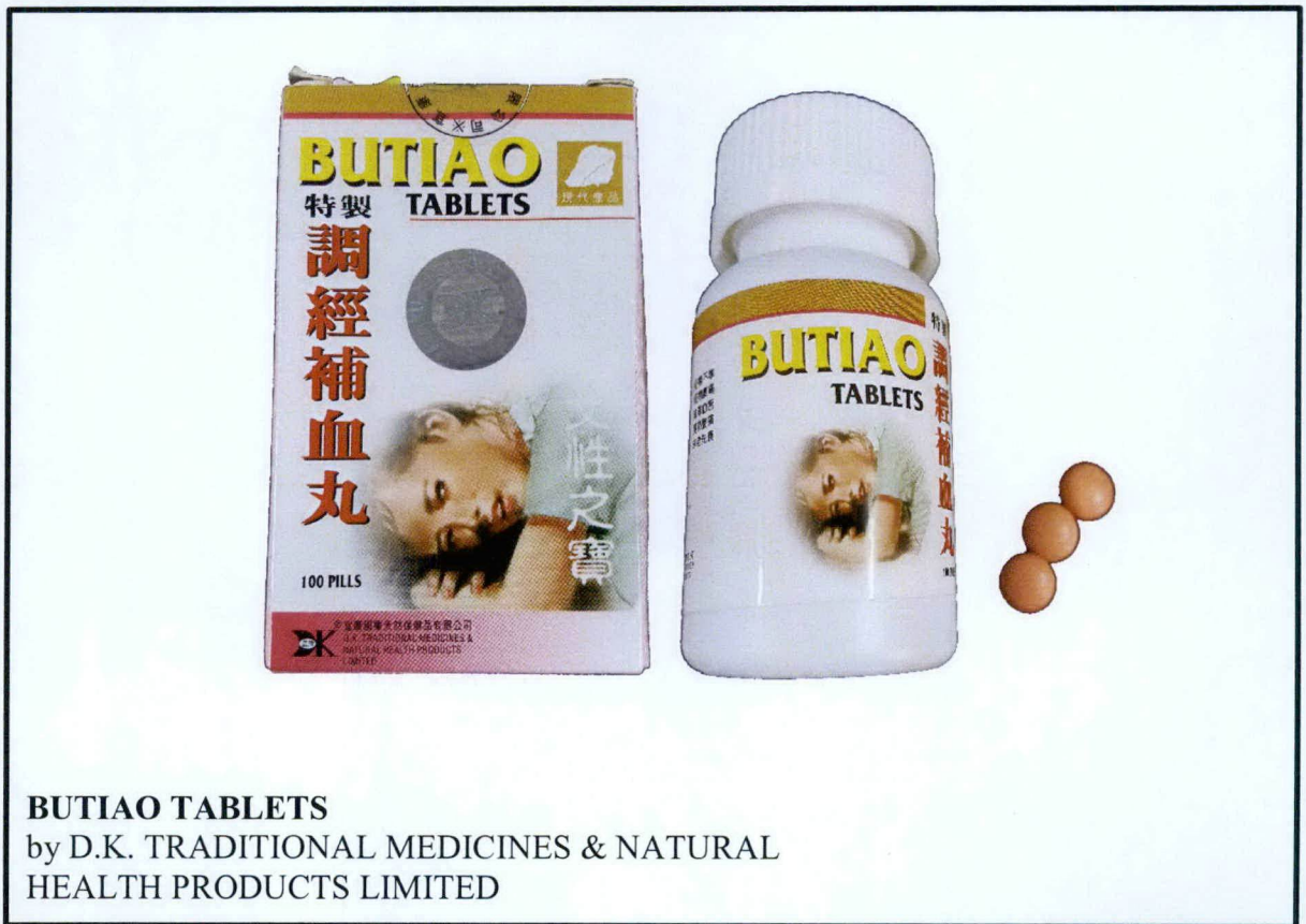
Larawan 5. Hindi rehistradong gamot