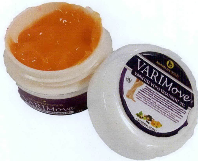
BEAUPPLUS GOLD VARIMove VARICOSE VEINS TREATMENT 15g GEL Exclusively Distributed By: BEAUPPLUS MARKETING