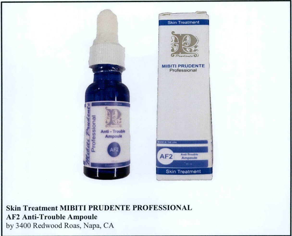
Skin Treatment MIBITI PRUDENTE PROFESSIONAL AF2 Anti-Trouble Ampoule by 3400 Redwood Roas, Napa, CA