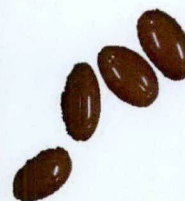
DK GASTROINTESTINAL REGULATING PILLS (INTESTINAL MEDICINE) by D.K TRADITIONAL MEDICINES & NATURAL HEALTH PRODUCTS LIMITED. HONG KONG