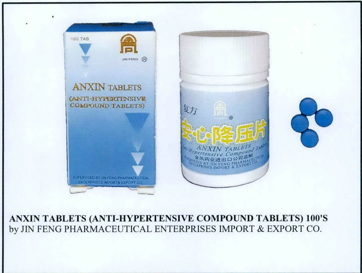
ANXIN TABLETS (ANTI-HYPERTENSIVE COMPOUND TABLETS) 100'S by JIN FENG PHARMACEUTICAL ENTERPRISES IMPORT & EXPORT CO.