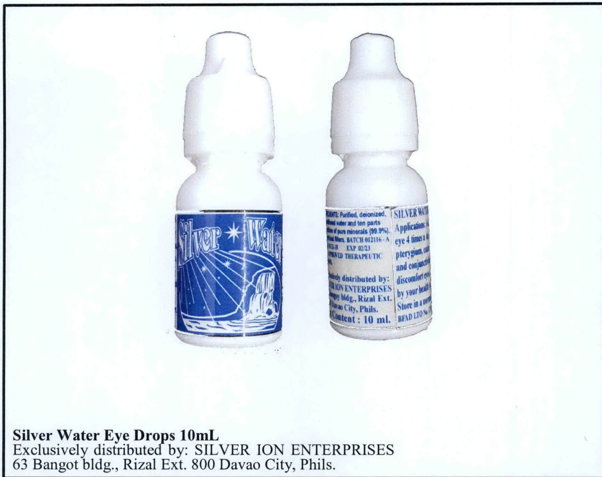
Silver Water Eye Drops 10mL Exclusively distributed by: SILVER ION ENTERPRISES 63 Bangot bldg., Rizal Ext. 800 Davao City, Phils.