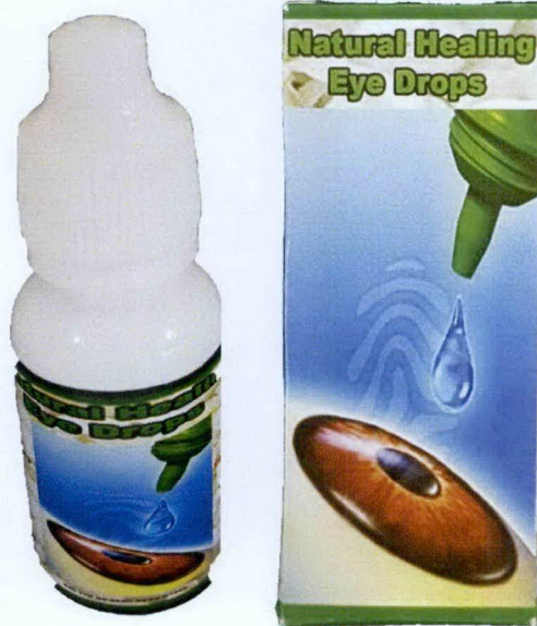
Natural Healing Eye Drops Manufactured by: Heal the World Foundation