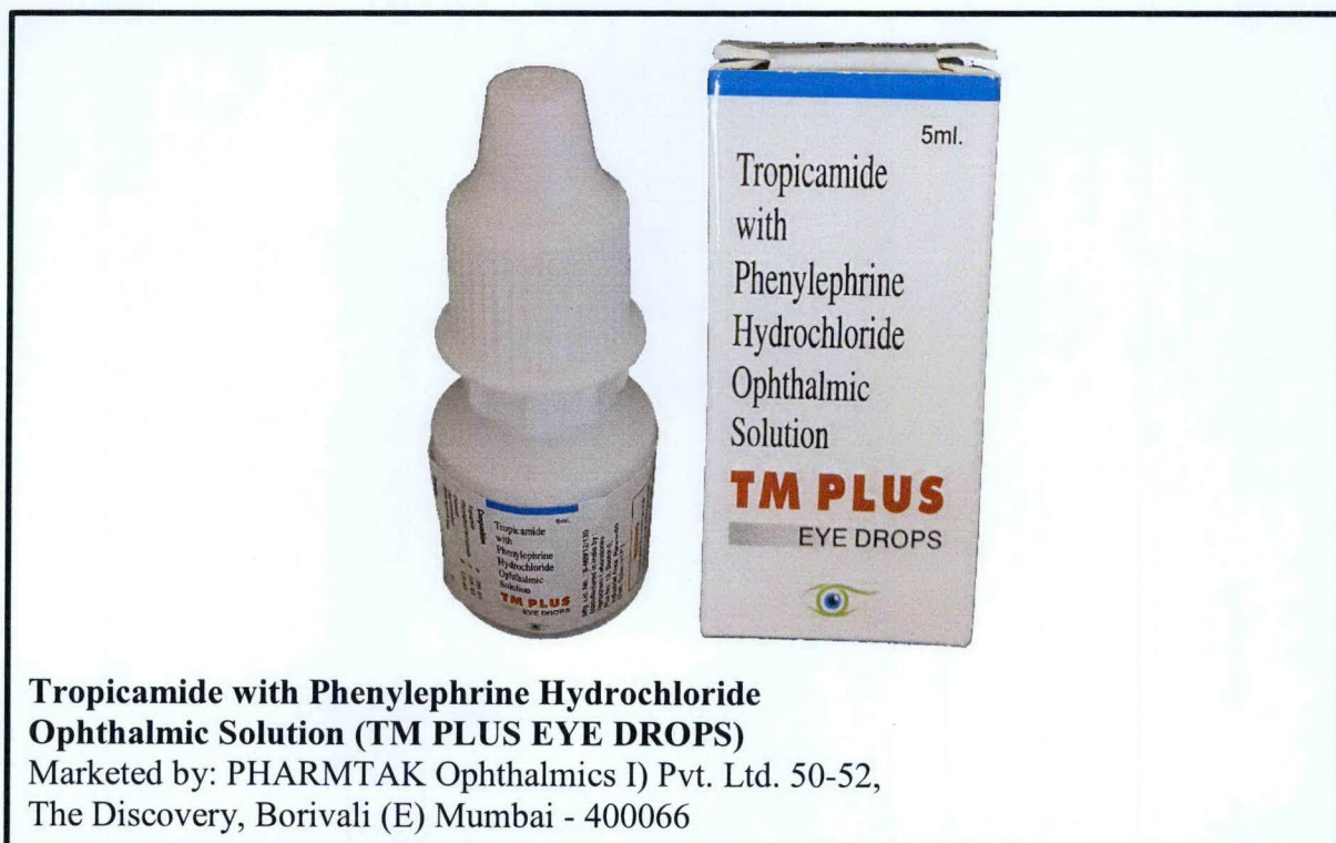
Tropicamide with Phenylephrine Hydrochloride Ophthalmic Solution (TM PLUS EYE DROPS) Marketed by: PHARMTAK Ophthalmics I) Pvt. Ltd. 50-52, The Discovery, Borivali (E) Mumbai - 400066