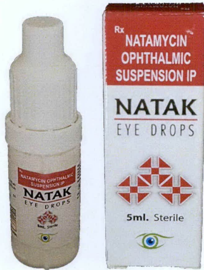
NATAMYCIN OPHTHALMIC SUSPENSION IP (NATAK) EYE DROPS 5ml Marketed by: PHARMTAK Ophthalmics I) Pvt. Ltd. 50-52, The Discovery, Borivali (E) Mumbai - 400 066