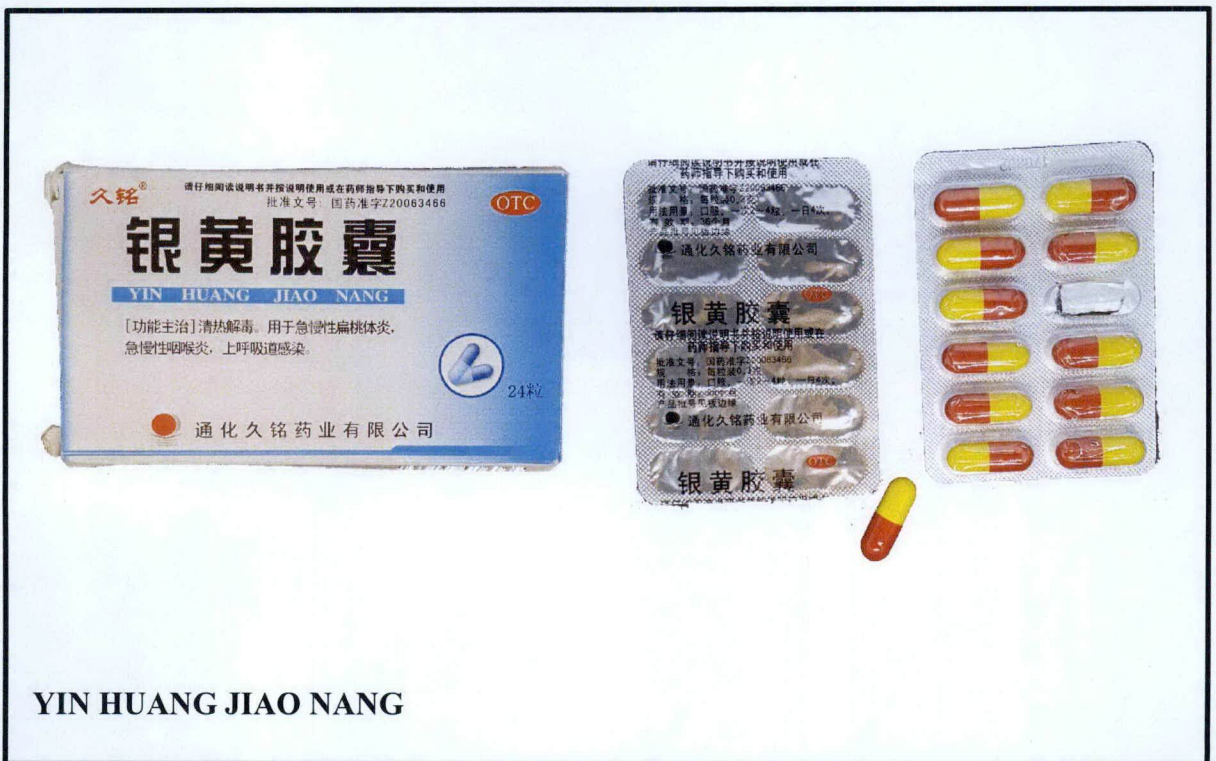
YIN HUANG JIAO NANG