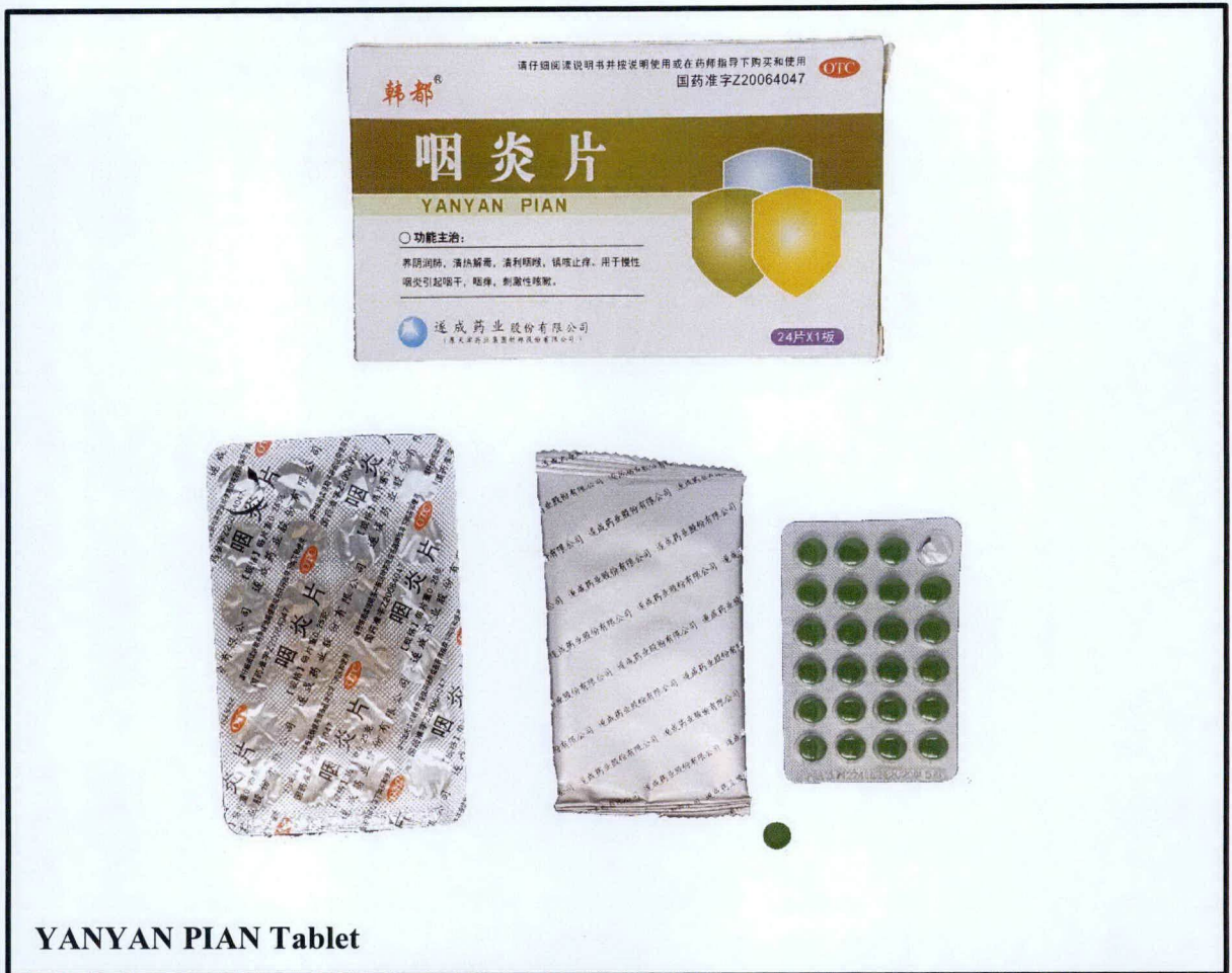
YANYAN PIAN Tablet