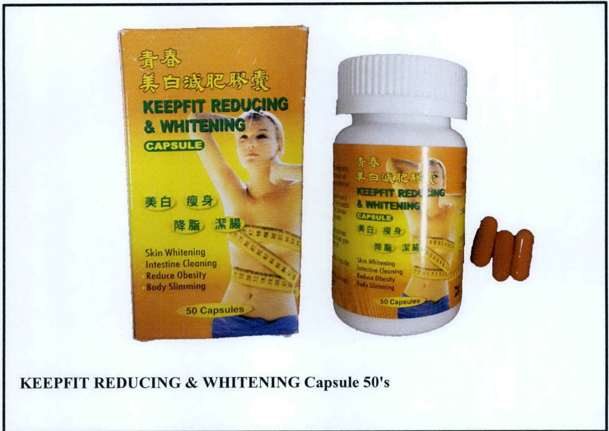
Larawan 6. Hindi rehistradong gamot

Napatunayan sa pamamagitan ng isinagawang Post-Marketing Surveillance (PMS) ng FDA na ang mga nasabing gamot ay hindi dumaan sa proseso ng rehistrasyon ng ahensya at hindi nabigyan ng kaukulang awtorisasyon tulad ng Certificate of Product Registration (CPR).