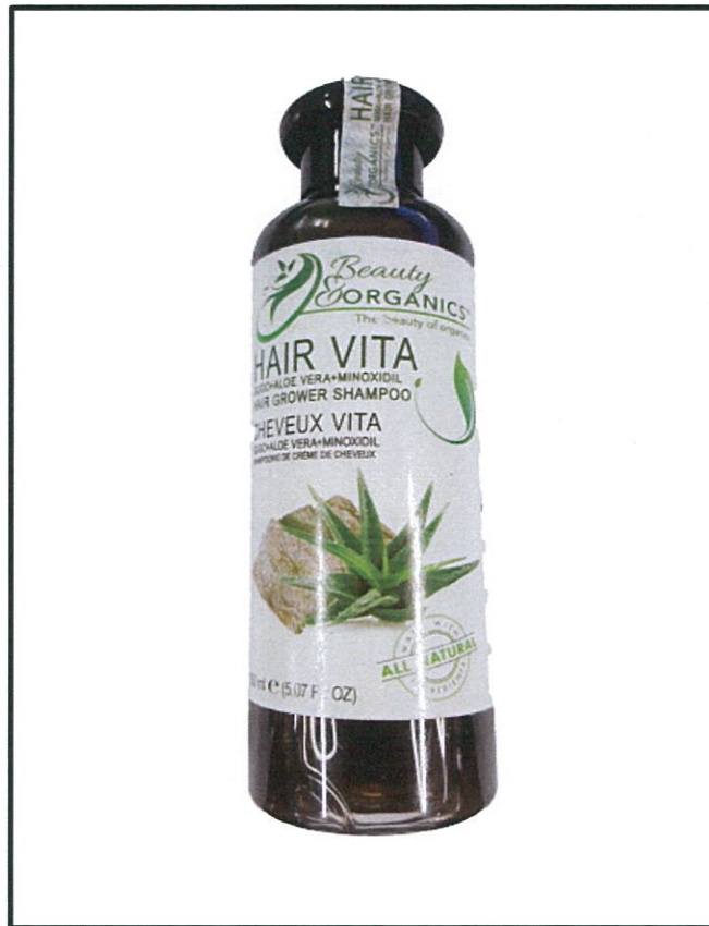
Larawan 1. Hindi rehistradong gamot Beauty Organics™ HAIR VITA (Gugo+Aloe Vera+Minoxidil) HAIR GROWER SHAMPOO 150 mL

Binabalaan ng Food and Drug Administration (FDA) ang publiko laban sa pagbili at paggamit ng mga hindi rehistradong gamot na: