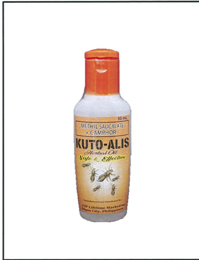
Larawan 2. Hindi rehistradong gamot METHYL SALICYLATE+CAMPHOR KUTO-ALIS Herbal Oil 50 mL

Napatunayan sa pamamagitan ng isinagawang Post-Marketing Surveillance (PMS) ng FDA na ang mga nasabing gamot ay hindi dumaaan sa proseso ng rehistrasyon ng ahensya at hindi nabigyan ng kaukulang awtorisasyon tulad ng Certificate of Product Registration (CPR).