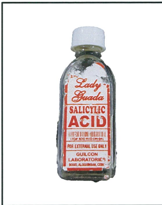
Larawan 1. Hindi rehistradong gamot Lady Guada SALICYLIC ACID 25 mL

Binabalaan ng Food and Drug Administration (FDA) ang publiko laban sa pagbili at paggamit ng mga hindi rehistradong gamot na: