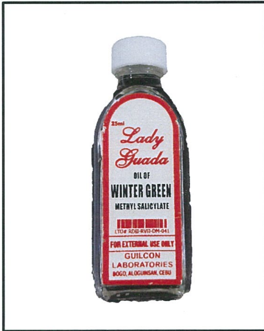
Larawan 3. Hindi rehistradong gamot Lady Guada OIL OF WINTER GREEN 25 mL