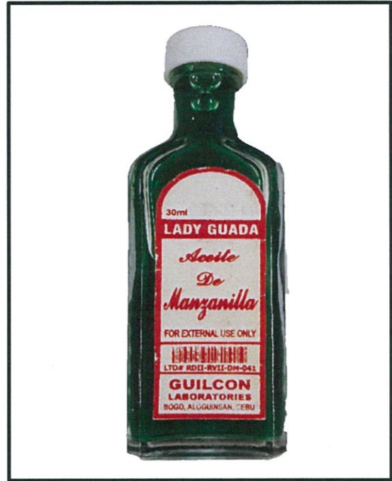
Larawan 4. Hindi rehistradong gamot Lady Guada Aceite De Manzanilla 30 mL