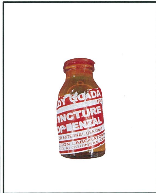
Larawan 2. Hindi rehistradong gamot Lady Guada TINCTURE OF BENZAL 15 mL