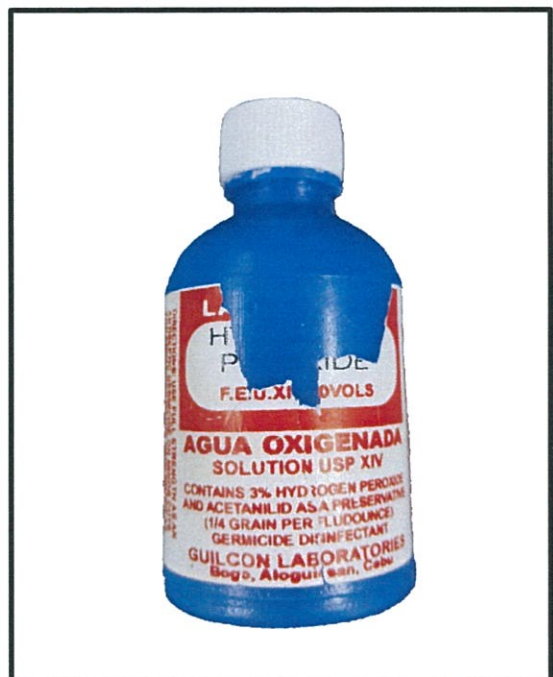
Larawan 6. Hindi rehistradong gamot Lady Guada HYDROGEN PEROXIDE AGUA OXIGENADA SOLUTION USP XIV