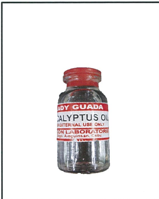
Larawan 5. Hindi rehistradong gamot Lady Guada EUCALYPTUS OIL 10 mL