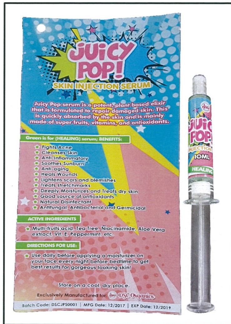
Larawan 1. Hindi rehistradong gamot: Juicy Pop! Skin Injection Serum

Binabalaan ng Food and Drug Administration (FDA) ang publiko laban sa pagbili at paggamit ng hindi rehistradong gamot na: