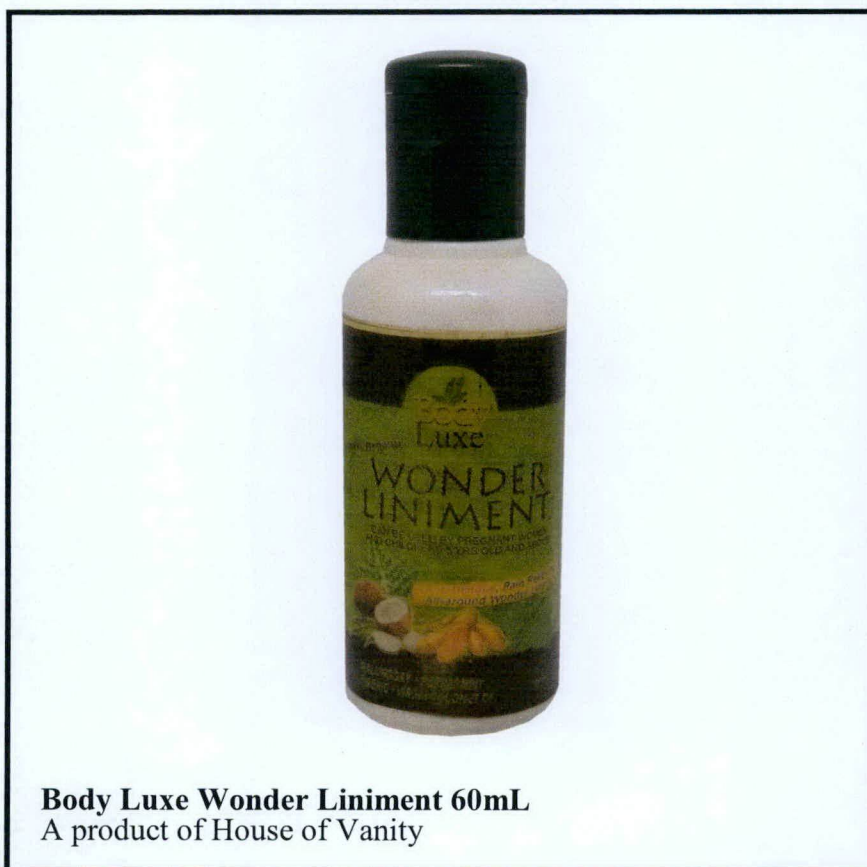
Larawan 1. Hindi rehistradong gamot

Pinapayuhan ng Food and Drug Administration (FDA) ang publiko laban sa pagbili at paggamit ng hindi rehistradong gamot na: