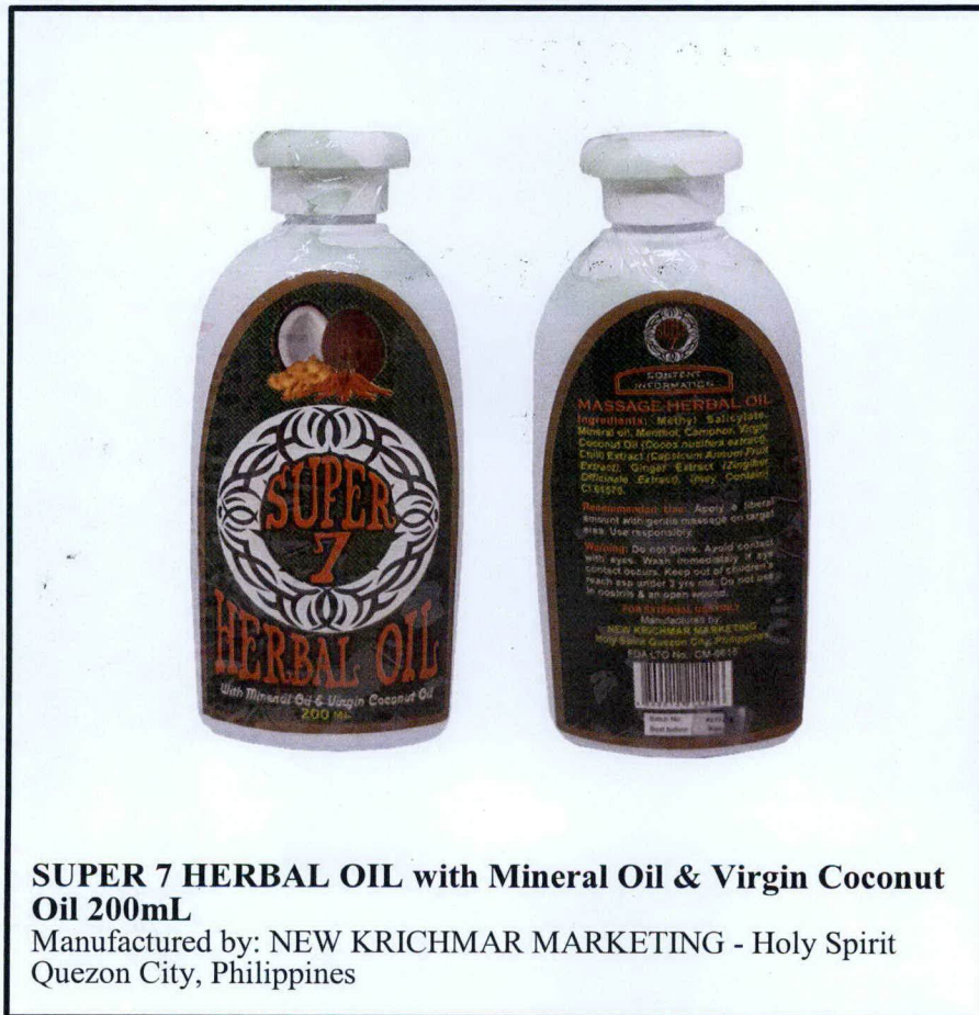
SUPER 7 HERBAL OIL with Mineral Oil & Virgin Coconut Oil 200mL Manufactured by: NEW KRICHMAR MARKETING - Holy Spirit Quezon City, Philippines

Pinapayuhan ng Food and Drug Administration (FDA) ang publiko laban sa pagbili at paggamit ng hindi rehistradong gamot na: