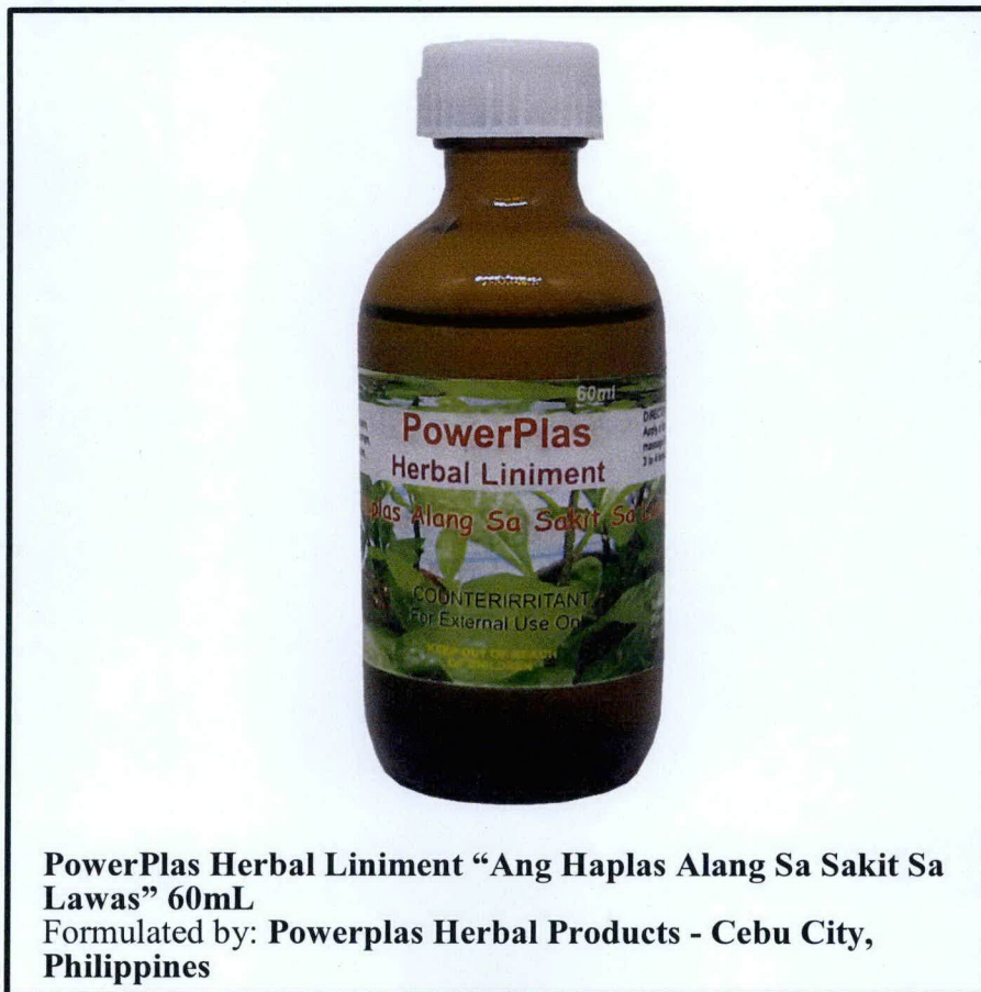
Larawan 1. Hindi rehistradong gamot

Pinapayuhan ng Food and Drug Administration (FDA) ang publiko laban sa pagbili at paggamit ng hindi rehistradong gamot na: