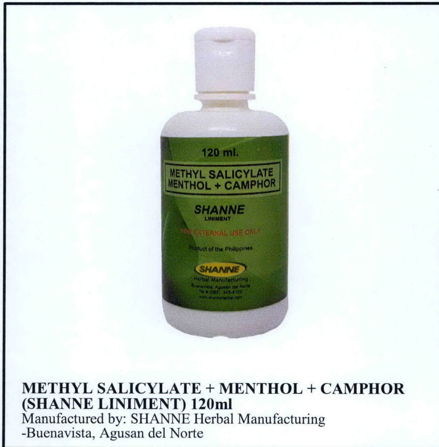
Larawan 1. Hindi rehistradong gamot

Pinapayuhan ng Food and Drug Administration (FDA) ang publiko laban sa pagbili at paggamit ng hindi rehistradong gamot na: