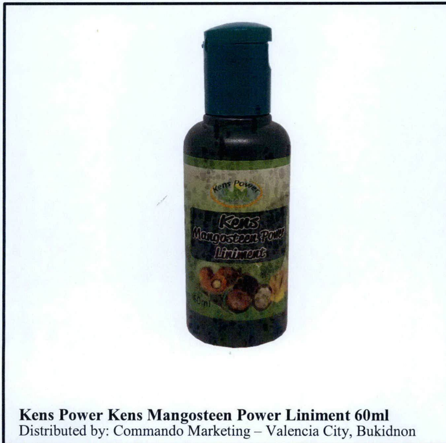
Kens Power Kens Mangosteen Power Liniment 60ml Distributed by: Commando Marketing – Valencia City, Bukidnon

Pinapayuhan ng Food and Drug Administration (FDA) ang publiko laban sa pagbili at paggamit ng mga hindi rehistradong gamot na: