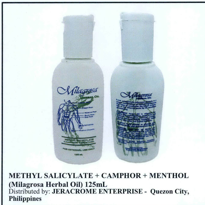
Larawan 1. Hindi rehistradong gamot

Pinapayuhan ng Food and Drug Administration (FDA) ang publiko laban sa pagbili at paggamit ng mga hindi rehistradong gamot na: