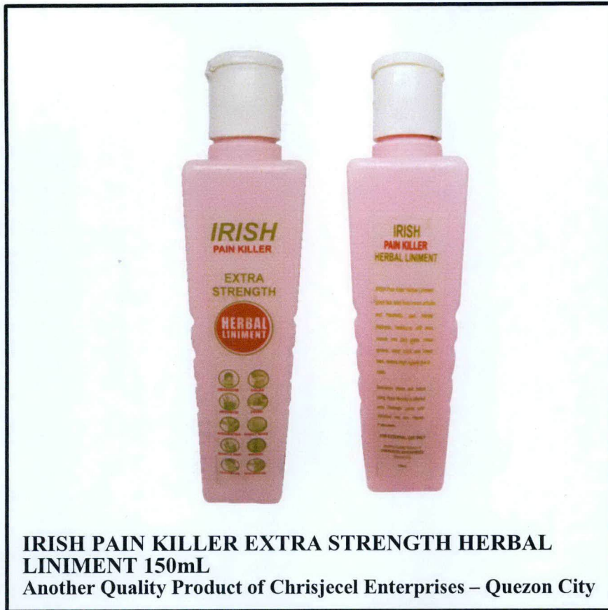
Larawan 2. Hindi rehistradong gamot