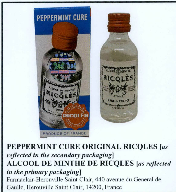
PEPPERMINT CURE ORIGINAL RICQLES [as reflected in the secondary packaging] ALCOOL DE MINTHE DE RICQLES [as reflected in the primary packaging] Farmaclair-Herouville Saint Clair, 440 avenue du General de Gaulle, Herouville Saint Clair, 14200, France