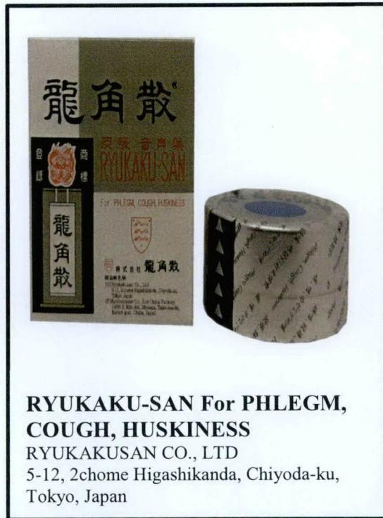
RYUKAKU-SAN For PHLEGM, COUGH, HUSKINESS RYUKAKUSAN CO., LTD 5-12, 2chome Higashikanda, Chiyoda-ku, Tokyo, Japan