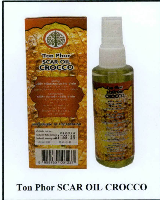
Ton Phor SCAR OIL CROCCO