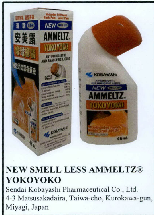
NEW SMELL LESS AMMELTZ® YOKOYOKO Sendai Kobayashi Pharmaceutical Co., Ltd. 4-3 Matsusakadaira, Taiwa-cho, Kurokawa-gun, Miyagi, Japan