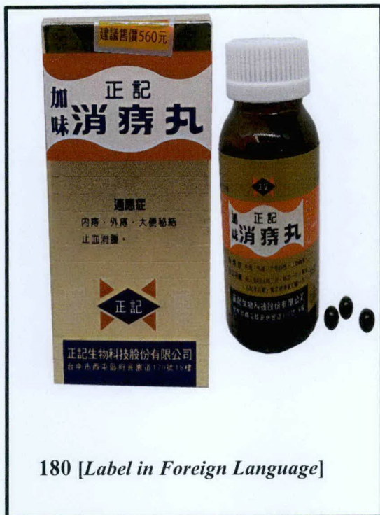
180 [Label in Foreign Language]