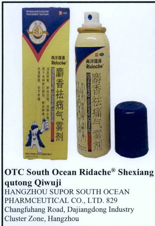
OTC South Ocean Ridache® Shexiang qutong Qiwuji

HANGZHOU SUPOR SOUTH OCEAN PHARMCEUTICAL CO., LTD. 829 Changfuhang Road, Dajiangdong Industry Cluster Zone, Hangzhou