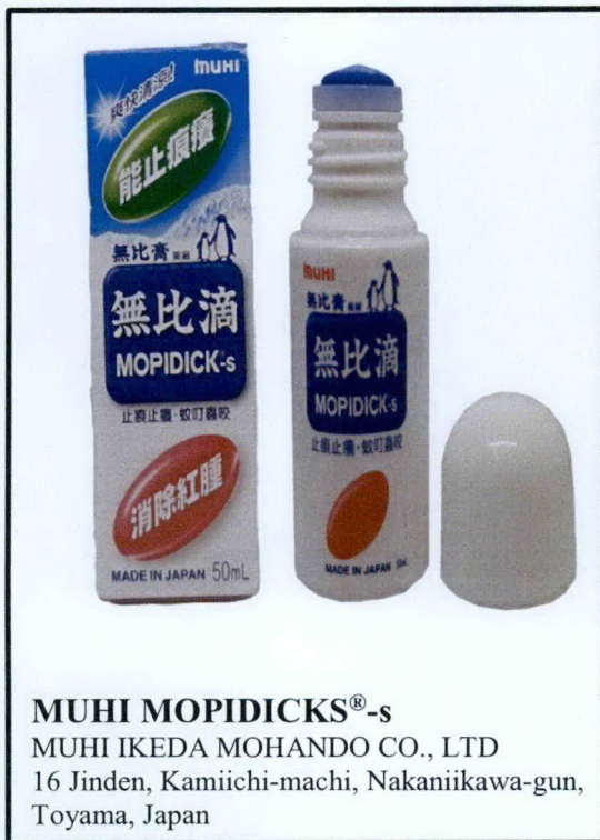
MUHI MOPIDICKS®-s MUHI IKEDA MOHANDO CO., LTD 16 Jinden, Kamiichi-machi, Nakaniikawa-gun, Toyama, Japan