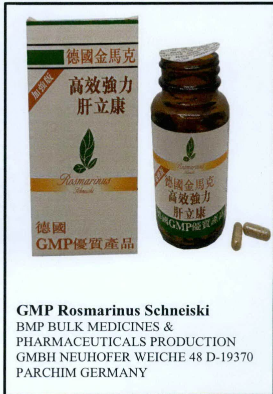
GMP Rosmarinus Schneiski

BMP BULK MEDICINES & PHARMACEUTICALS PRODUCTION GMBH NEUHOFFER WEICHE 48 D-19370 PARCHIM GERMANY