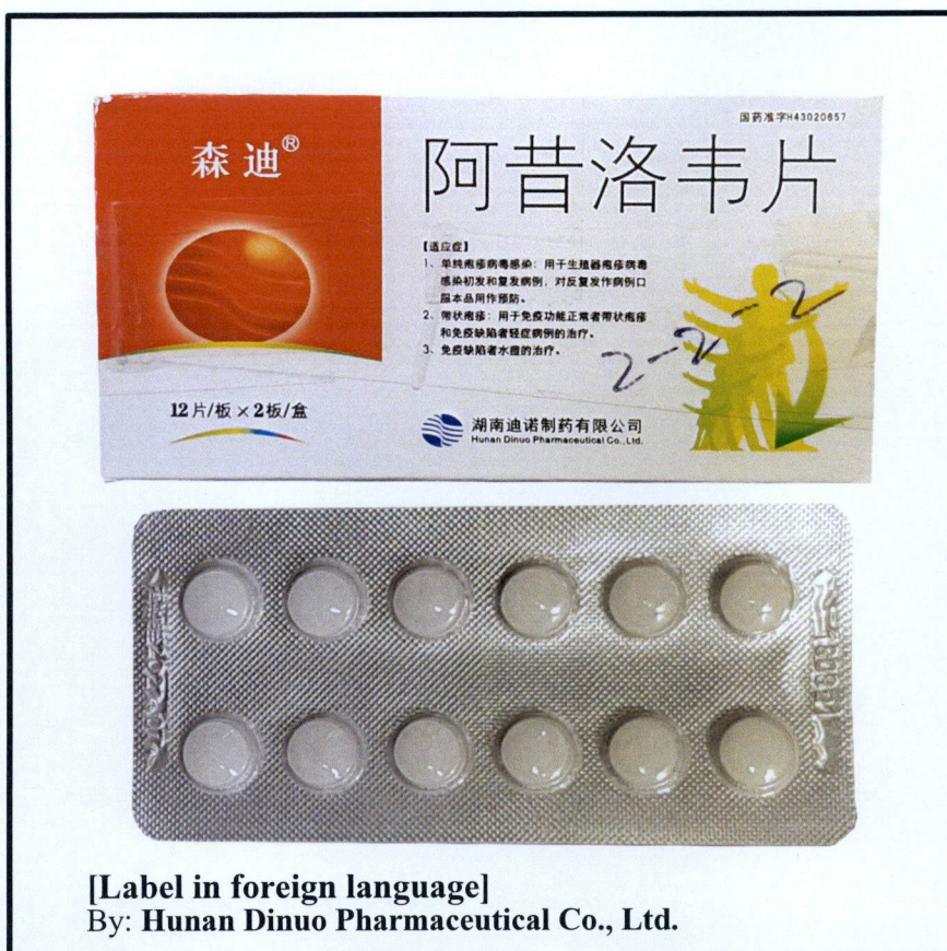
Larawan 2. Hindi rehistradong gamot

Napatunayan sa pamamagitan ng isinagawang Post-Marketing Surveillance (PMS) ng FDA na ang nasabing mga gamot ay hindi dumaan sa proseso ng rehistrasyon o pag-eeksamin ng Ahensya at hindi nabigyan ng kaukulang awtorisasyon tulad ng Certificate of Product Registration (CPR). Samakatuwid, hindi masisiguro ng Ahensya ang kalidad at kaligtasan nito. Ang nasabing mga iligal na produkto ay maaaring magdulot ng panganib sa kalusugan ng mga gagamit nito.