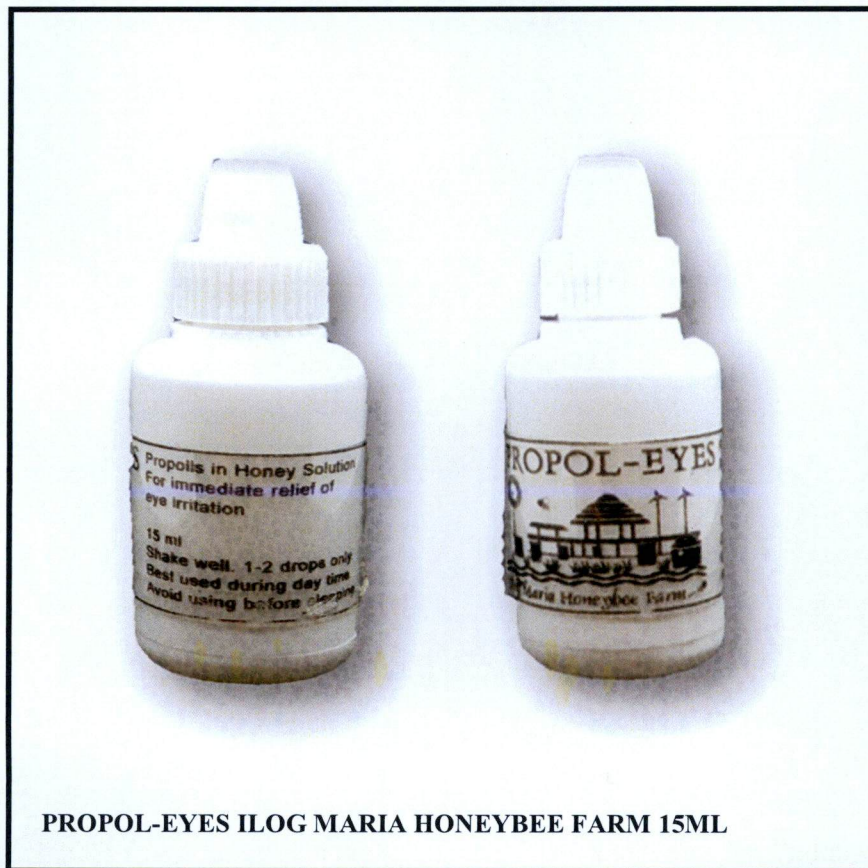
PROPOL-EYES ILOG MARIA HONEYBEE FARM 15ML

Pinapayuhan ng Food and Drug Administration (FDA) ang publiko laban sa pagbili at paggamit ng hindi rehistradong gamot na: