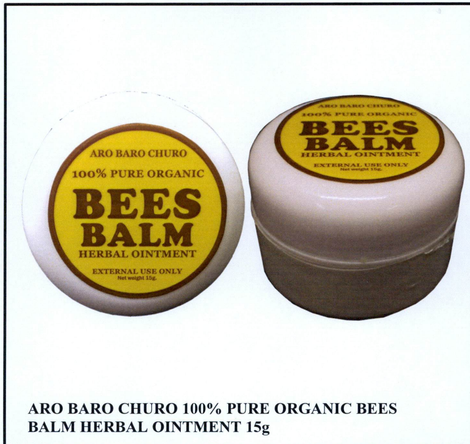
Larawan 1. Hindi rehistradong gamot

Pinapayuhan ng Food and Drug Administration (FDA) ang publiko laban sa pagbili at paggamit ng hindi rehistradong gamot na: