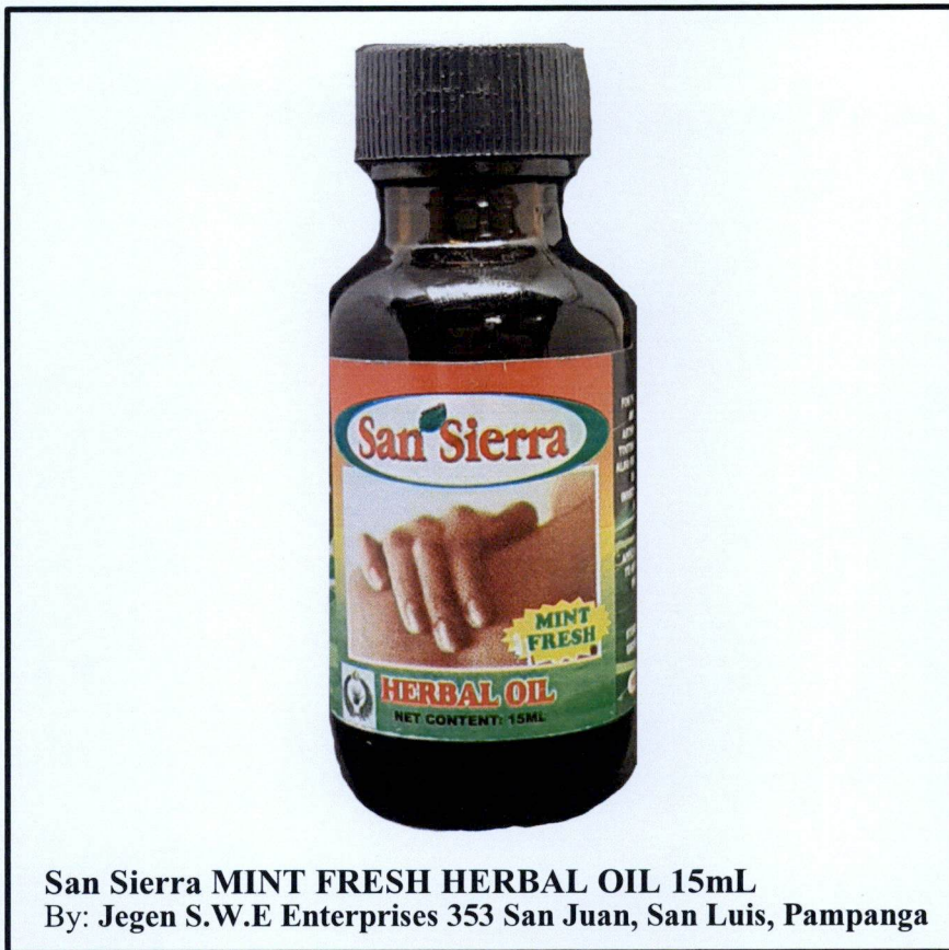
San Sierra MINT FRESH HERBAL OIL 15mL By: Jegen S.W.E Enterprises 353 San Juan, San Luis, Pampanga