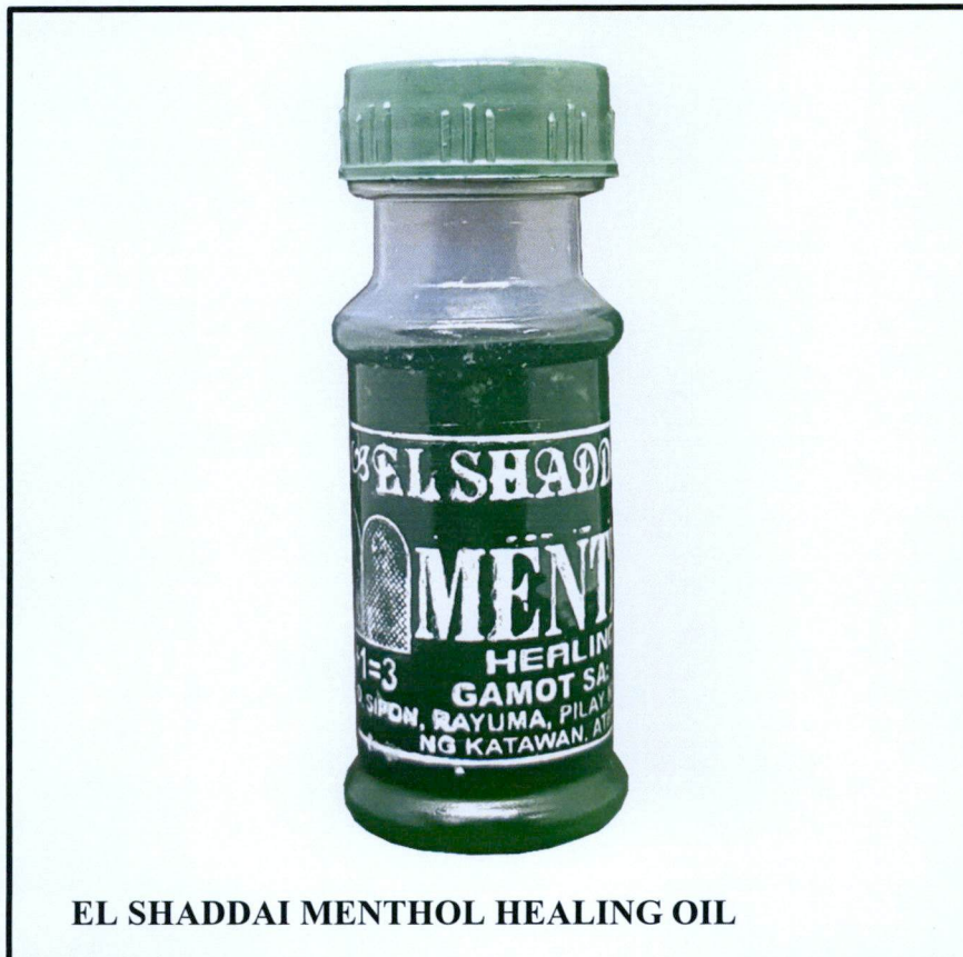
EL SHADDAI MENTHOL HEALING OIL

Pinapayuhan ng Food and Drug Administration (FDA) ang publiko laban sa pagbili at paggamit ng mga hindi rehistradong gamot na: