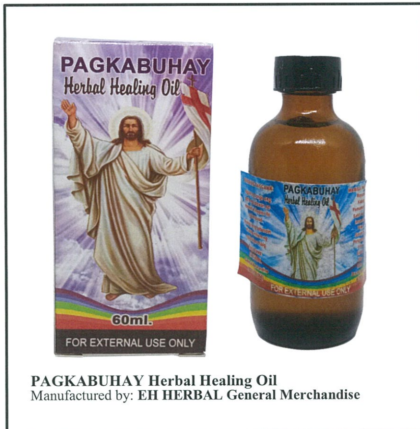
PAGKABUHAY Herbal Healing Oil Manufactured by: EH HERBAL General Merchandise

Pinapayuhan ng Food and Drug Administration (FDA) ang publiko laban sa pagbili at paggamit ng hindi rehistradong gamot na: