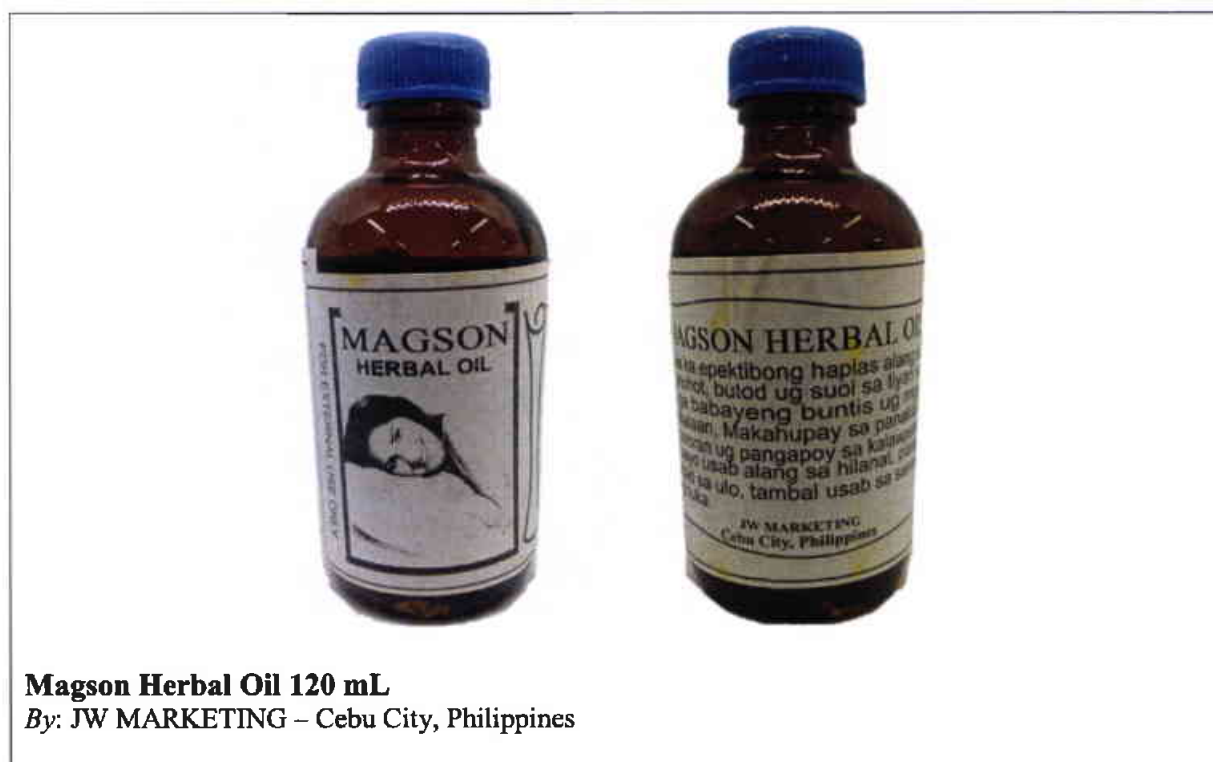
Larawan 8. Hindi rehistradong gamot