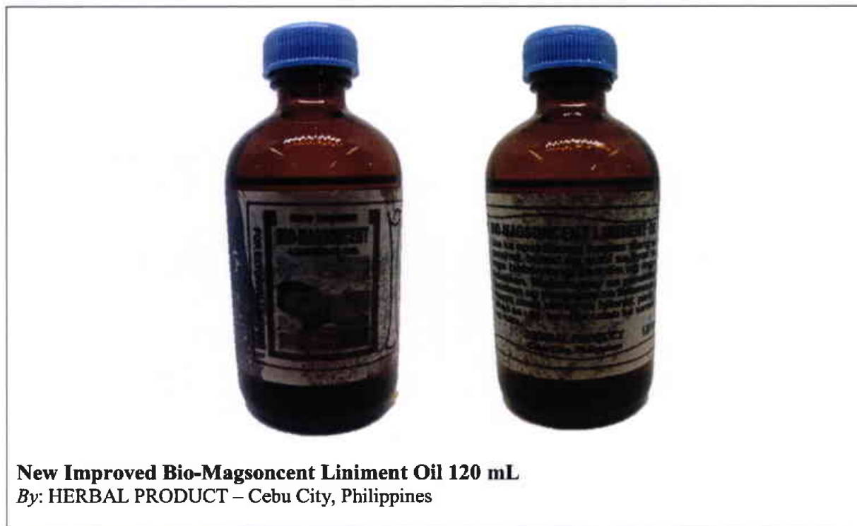
Larawan 7. Hindi rehistradong gamot