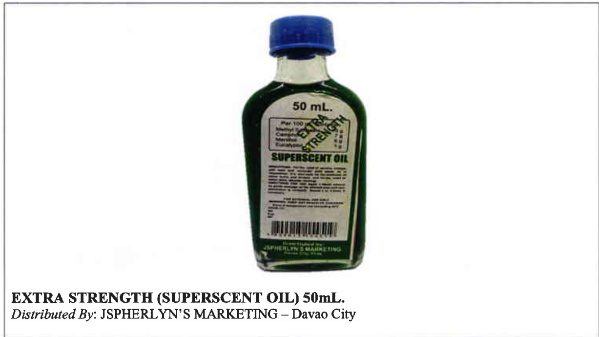
Larawan 10. Hindi rehistradong gamot