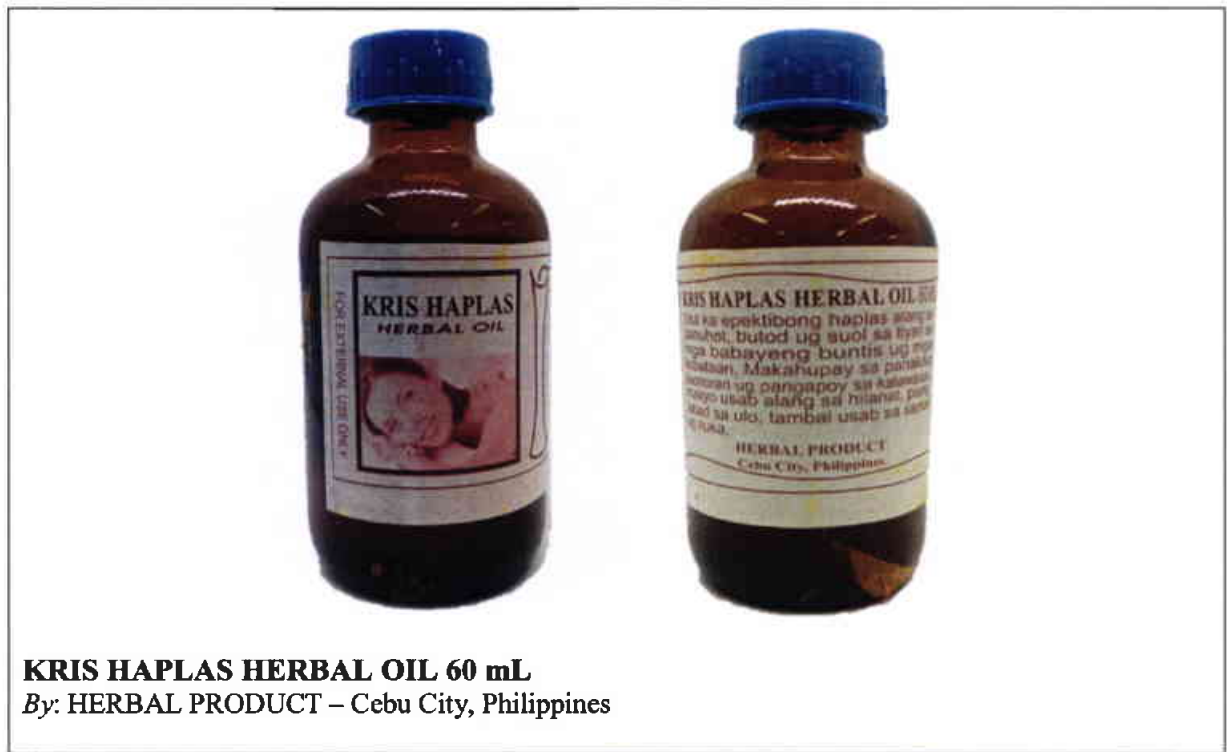
Larawan 9. Hindi rehistradong gamot