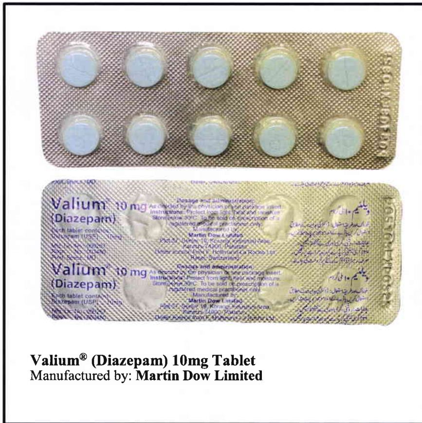
Valium® (Diazepam) 10mg Tablet Manufactured by: Martin Dow Limited