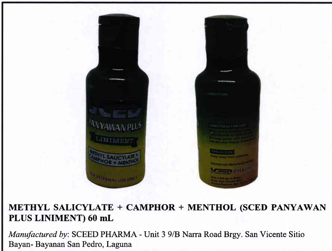
Larawan 1. Hindi rehistradong gamot

Pinapayuhan ng Food and Drug Administration (FDA) ang publiko laban sa pagbili at paggamit ng hindi rehistradong mga gamot na: