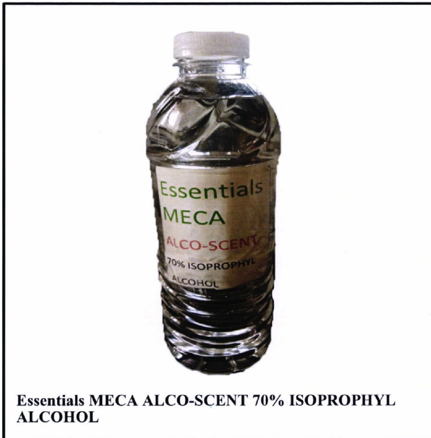
Essentials MECA ALCO-SCENT 70% ISOPROPYL ALCOHOL