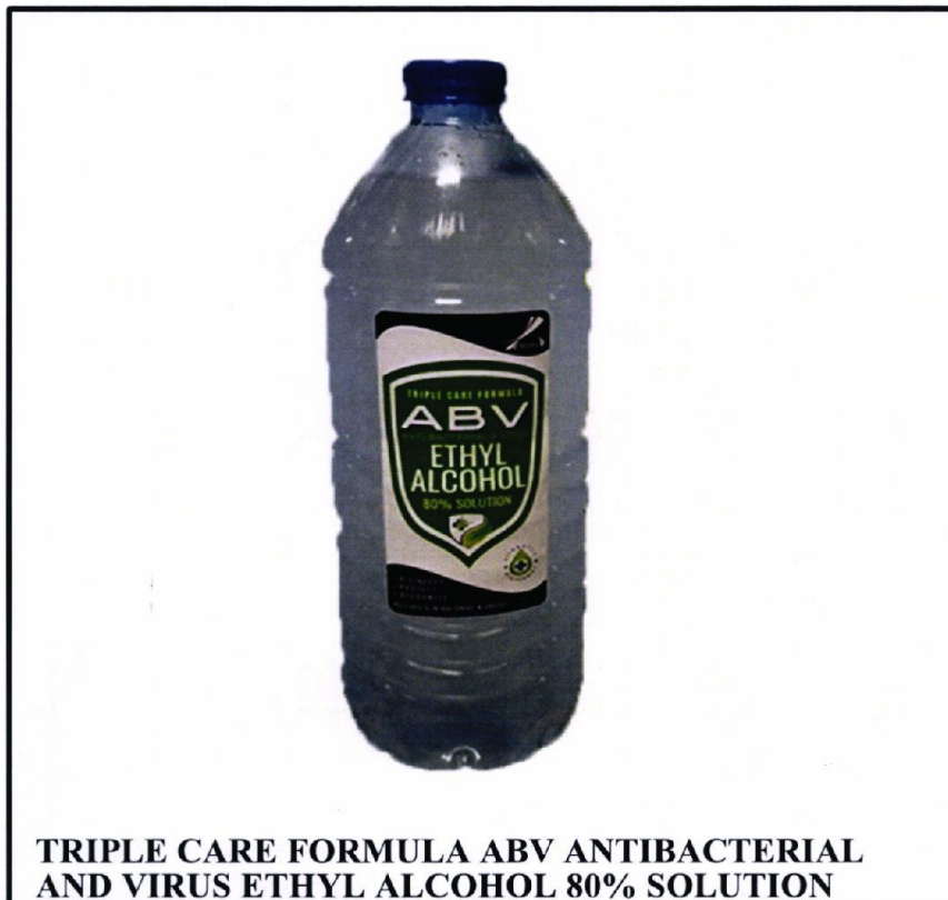
TRIPLE CARE FORMULA ABV ANTIBACTERIAL AND VIRUS ETHYL ALCOHOL 80% SOLUTION