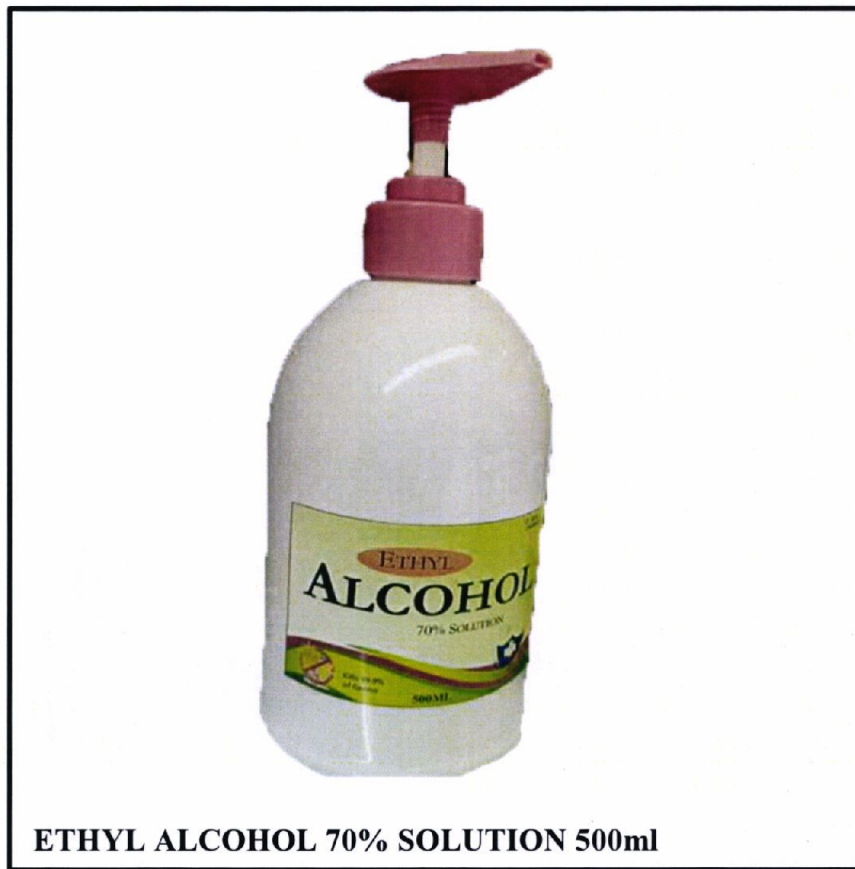
ETHYL ALCOHOL 70% SOLUTION 500ml