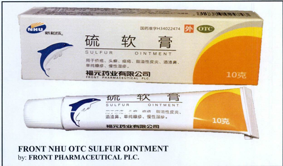
Larawan 16. Hindi rehistradong gamot