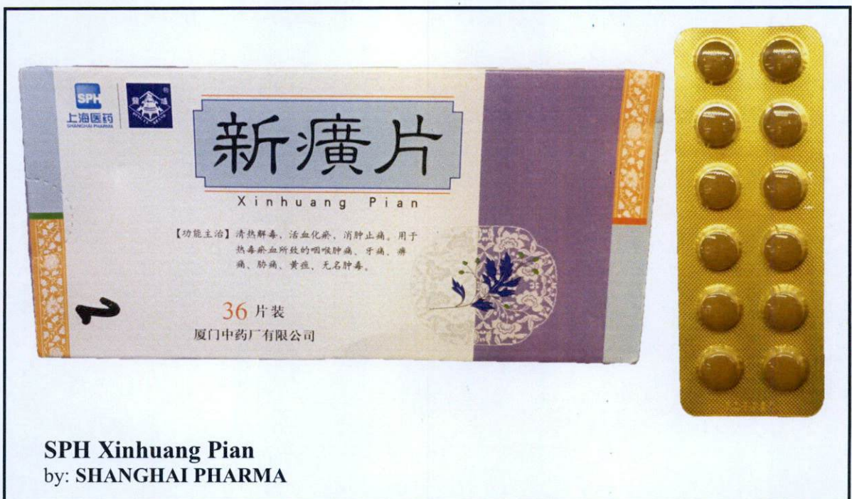
Larawan 13. Hindi rehistradong gamot