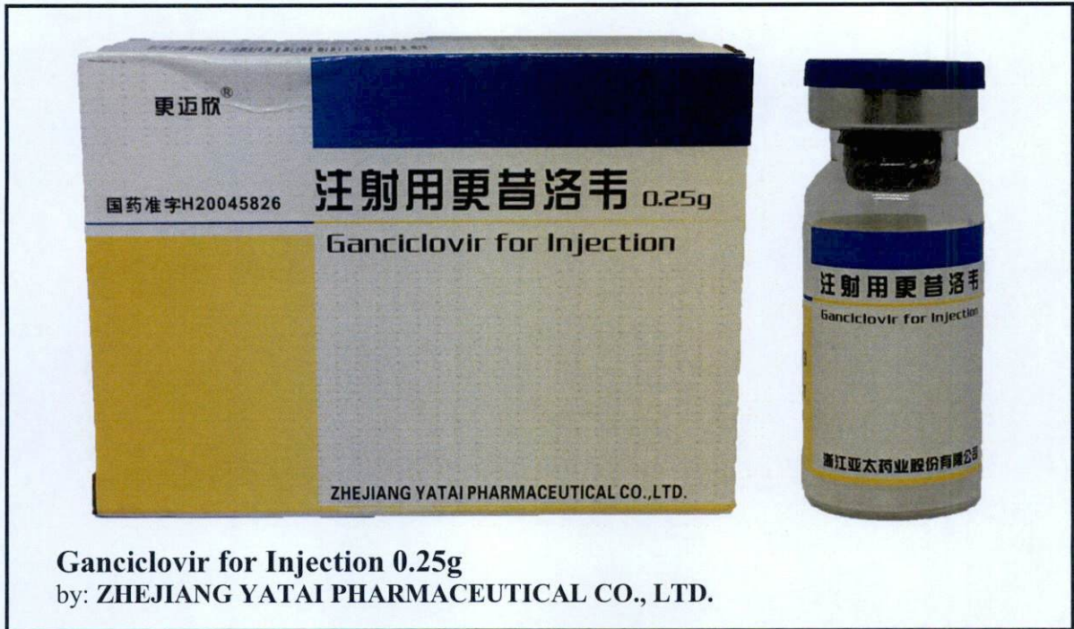
Larawan 8. Hindi rehistradong gamot