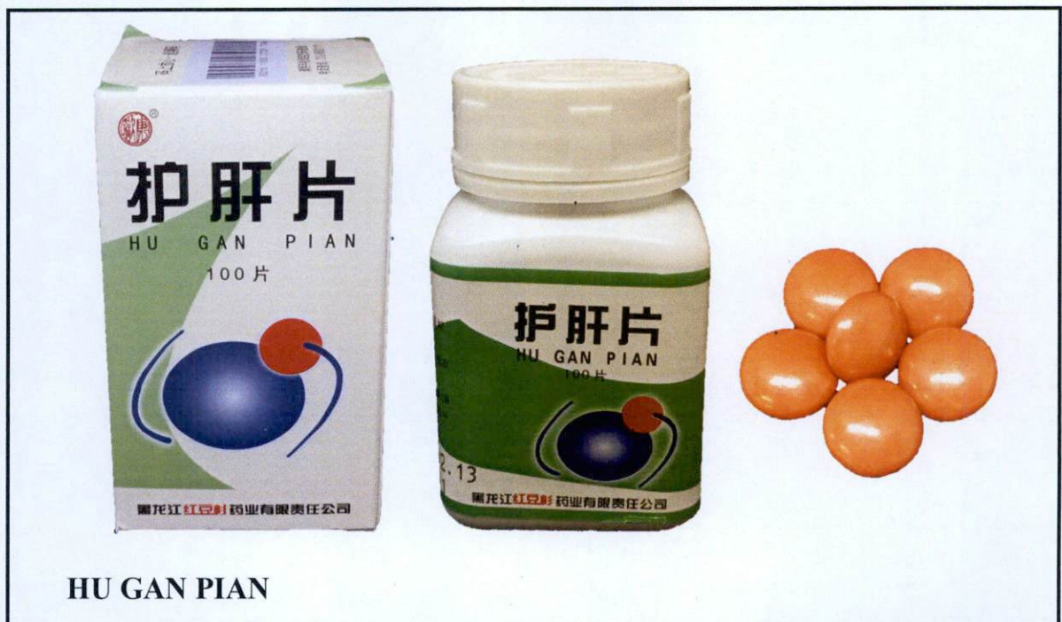
Larawan 19. Hindi rehistradong gamot