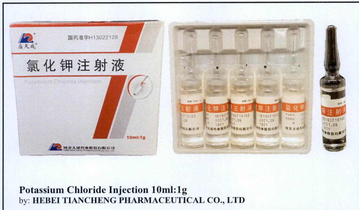
Potassium Chloride Injection 10ml:1g by: HEBEI TIANCHENG PHARMACEUTICAL CO., LTD