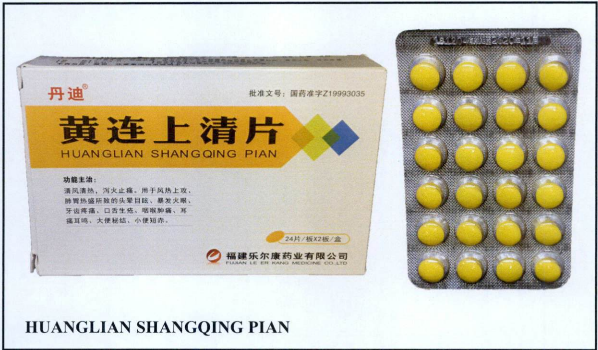
HUANGLIAN SHANGQING PIAN