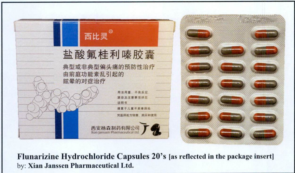
Larawan 22. Hindi rehistradong gamot