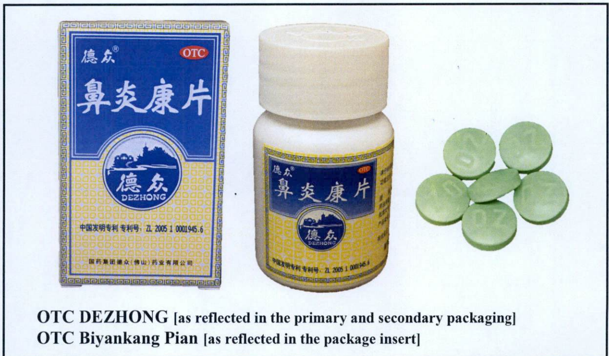
OTC DEZHONG [as reflected in the primary and secondary packaging] OTC Biyankang Pian [as reflected in the package insert]