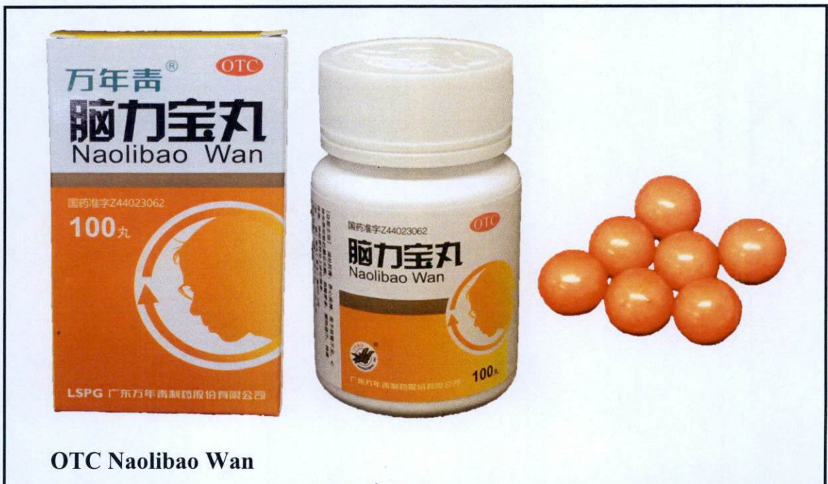
Larawan 17. Hindi rehistradong gamot