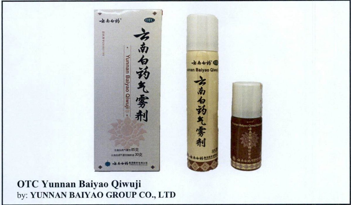
OTC Yunnan Baiyao Qiwuji by: YUNNAN BAIYAO GROUP CO., LTD