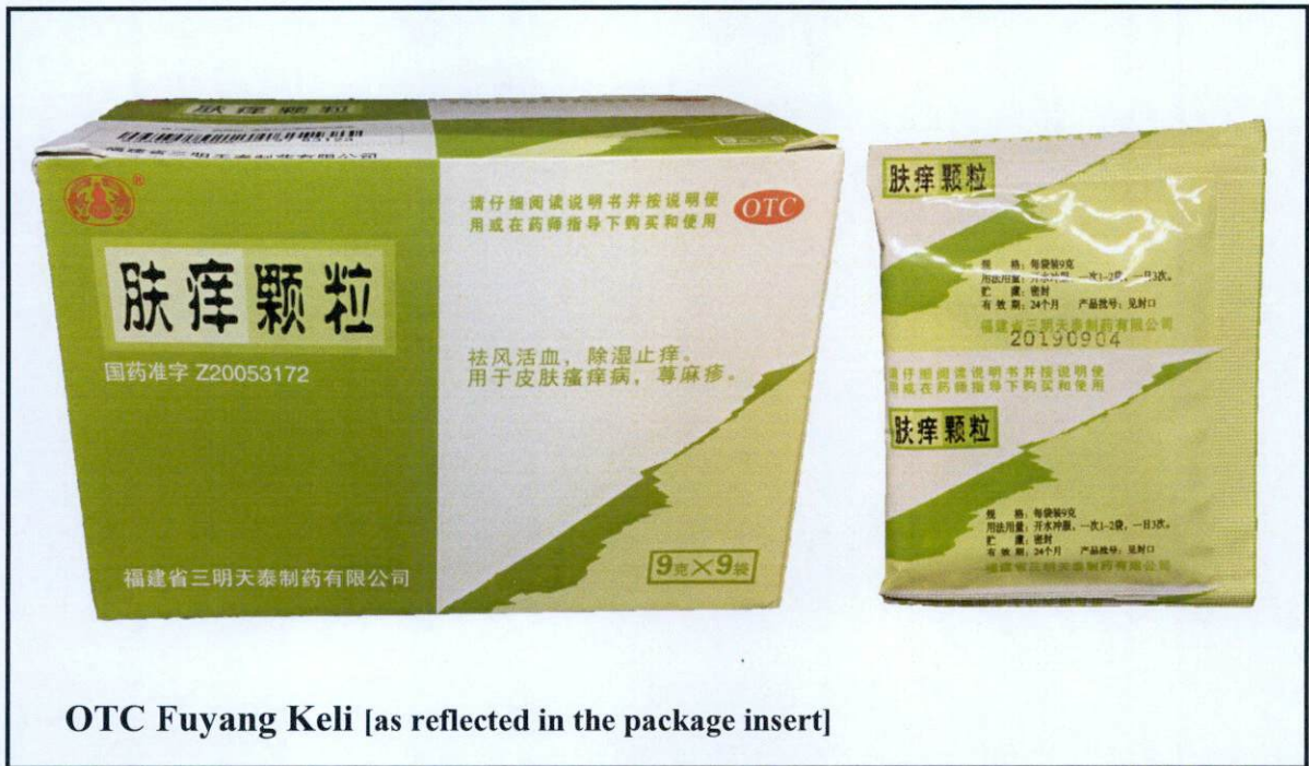
Larawan 9. Hindi rehistradong gamot