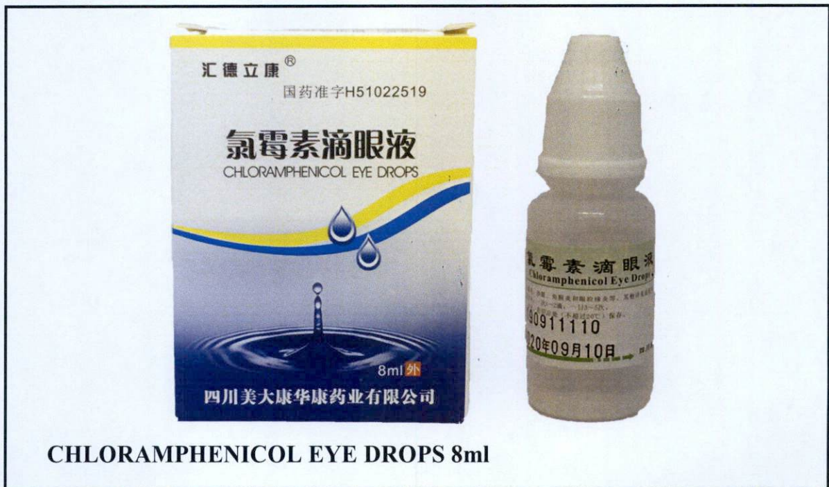
CHLORAMPHENICOL EYE DROPS 8ml