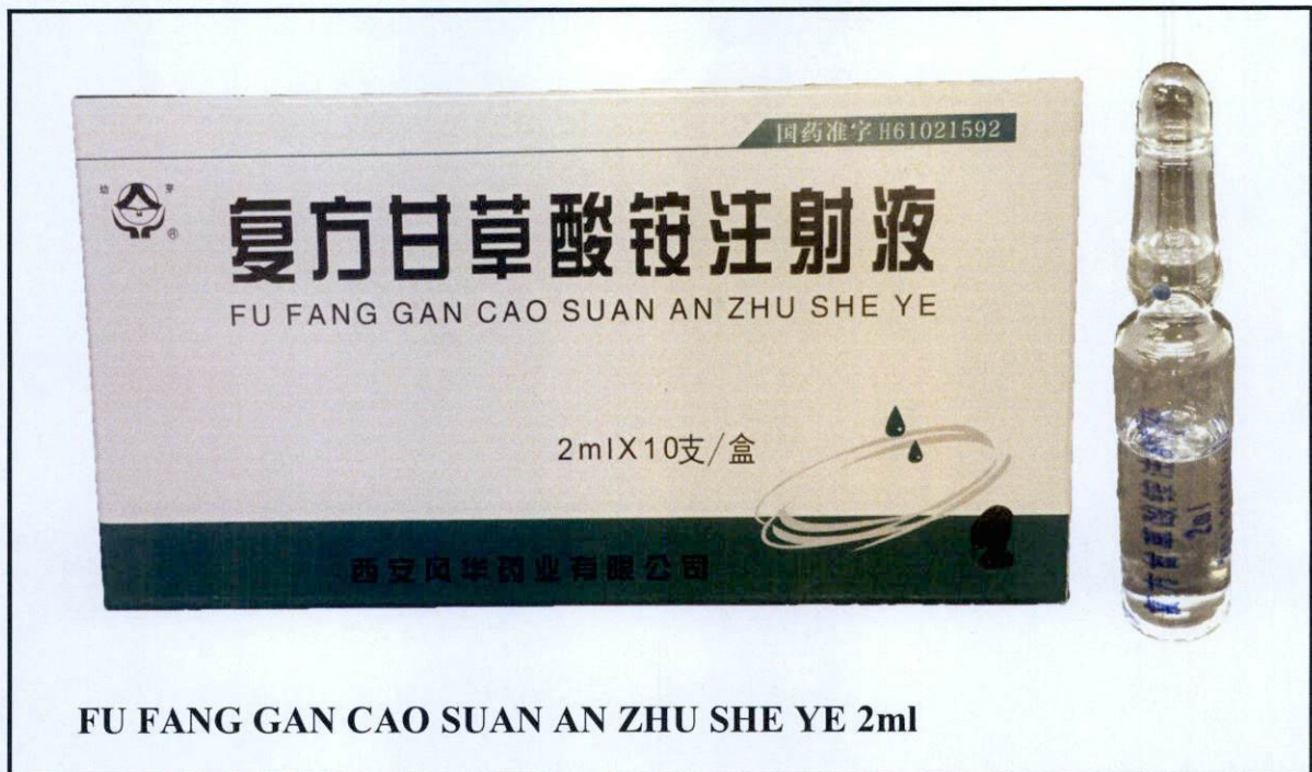
Larawan 12. Hindi rehistradong gamot