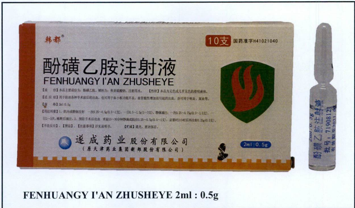
FENHUANGY I'AN ZHUSHEYE 2ml : 0.5g