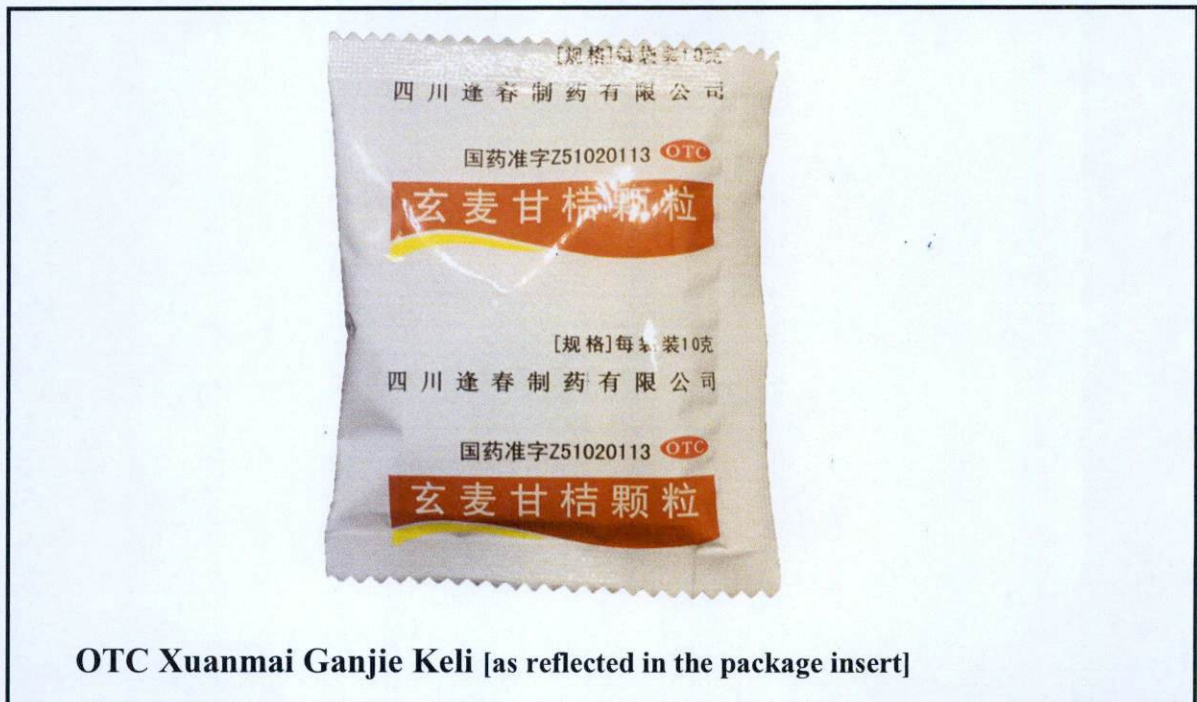
OTC Xuanmai Ganjie Keli [as reflected in the package insert]