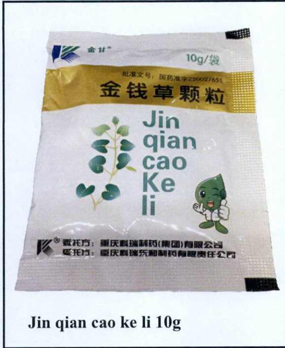
Jin qian cao ke li 10g