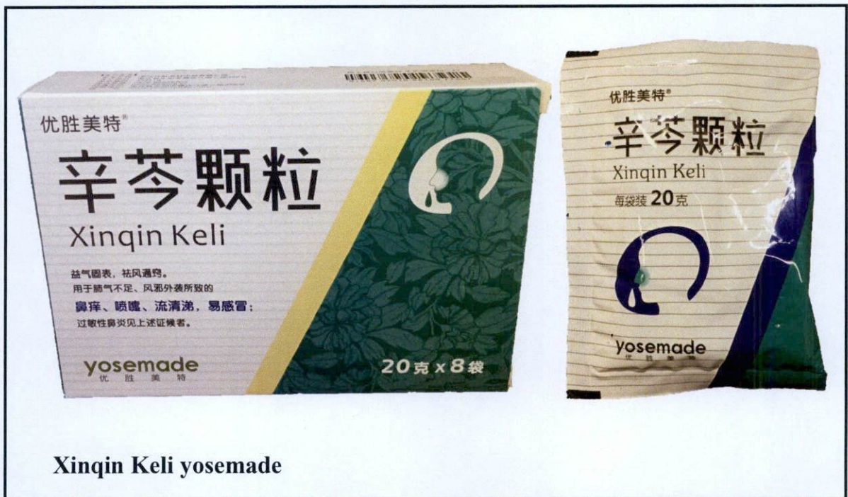
Larawan 23. Hindi rehistradong gamot