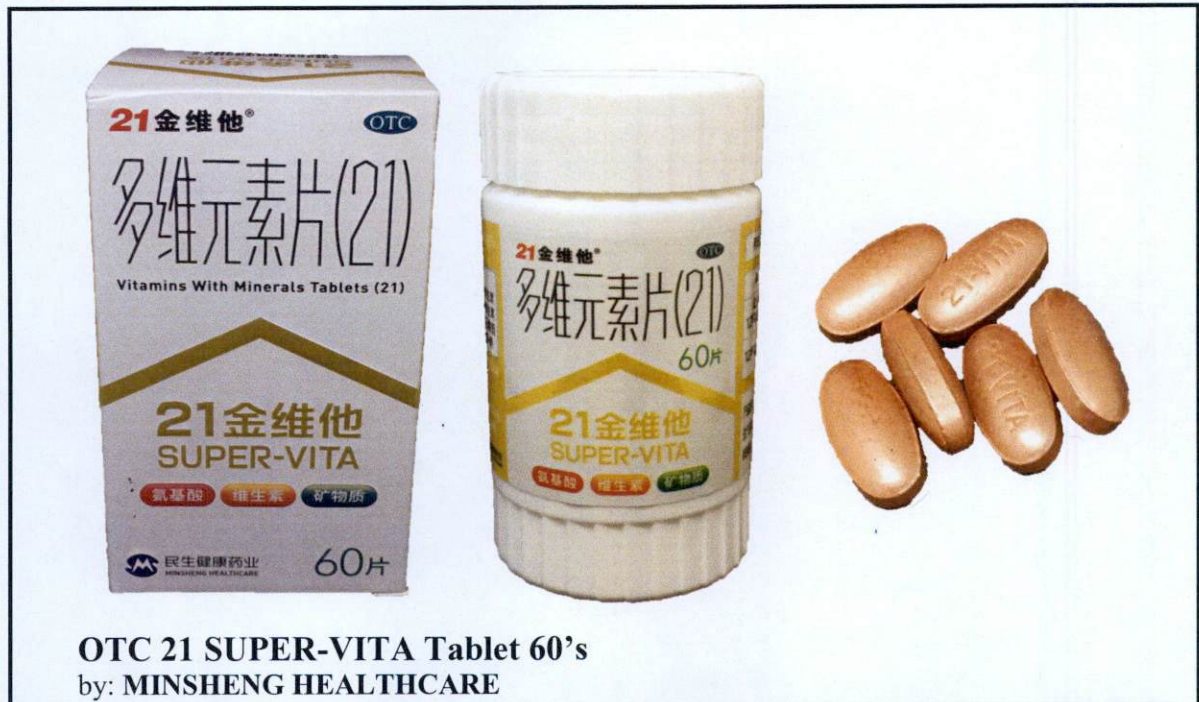
Larawan 18. Hindi rehistradong gamot