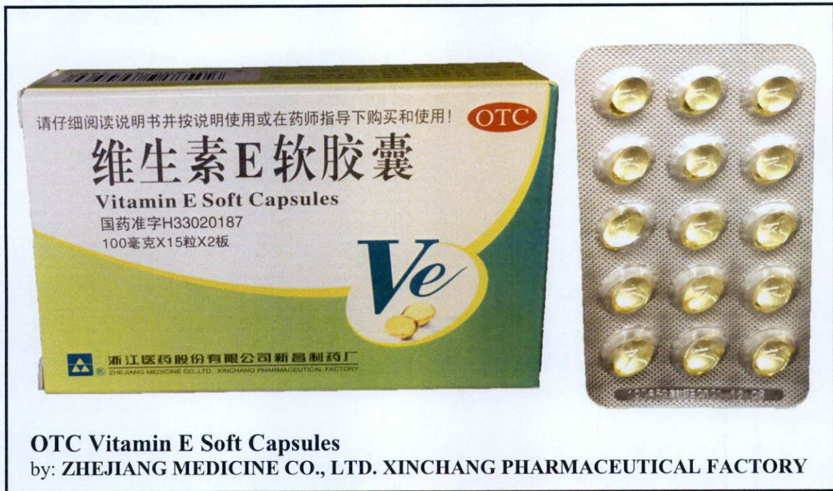
OTC Vitamin E Soft Capsules by: ZHEJIANG MEDICINE CO., LTD. XINCHANG PHARMACEUTICAL FACTORY