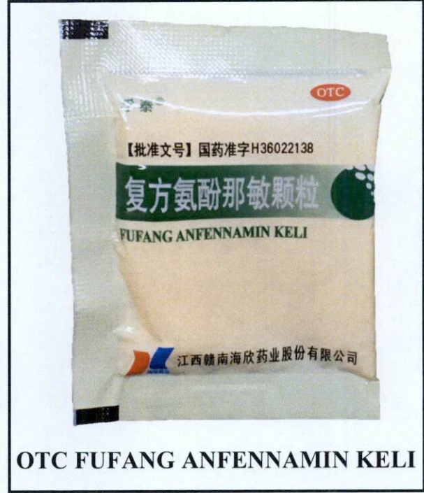
OTC FUFANG ANFENNAMIN KELI