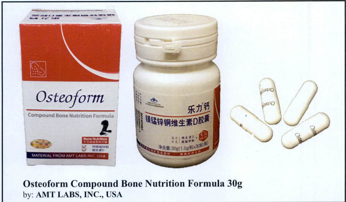
Osteoform Compound Bone Nutrition Formula 30g by: AMT LABS, INC., USA