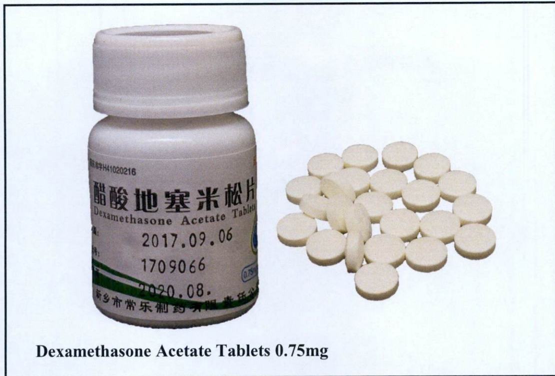
Dexamethasone Acetate Tablets 0.75mg