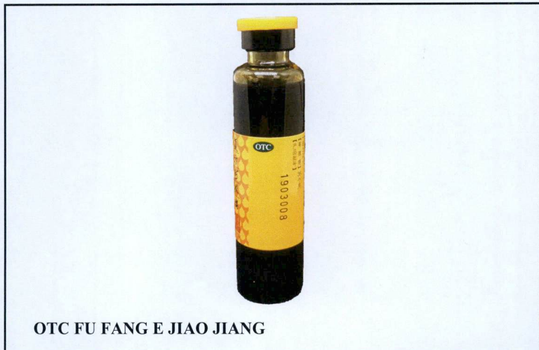
OTC FU FANG E JIAO JIANG