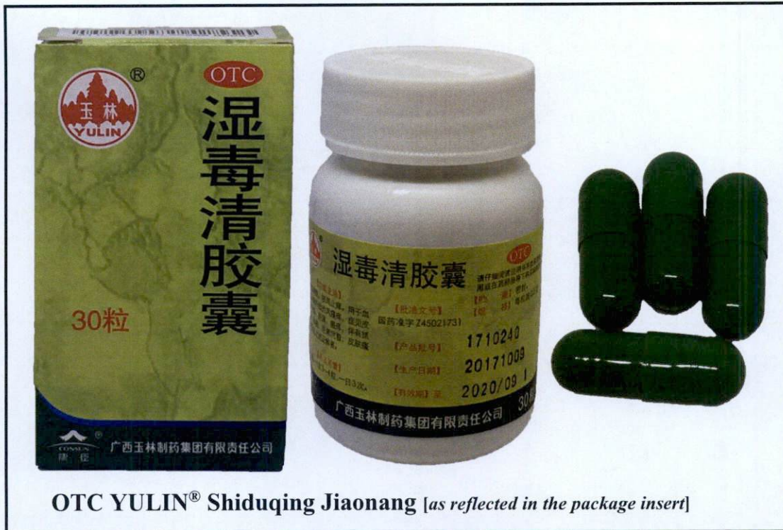
Larawan 2. Hindi rehistradong gamot