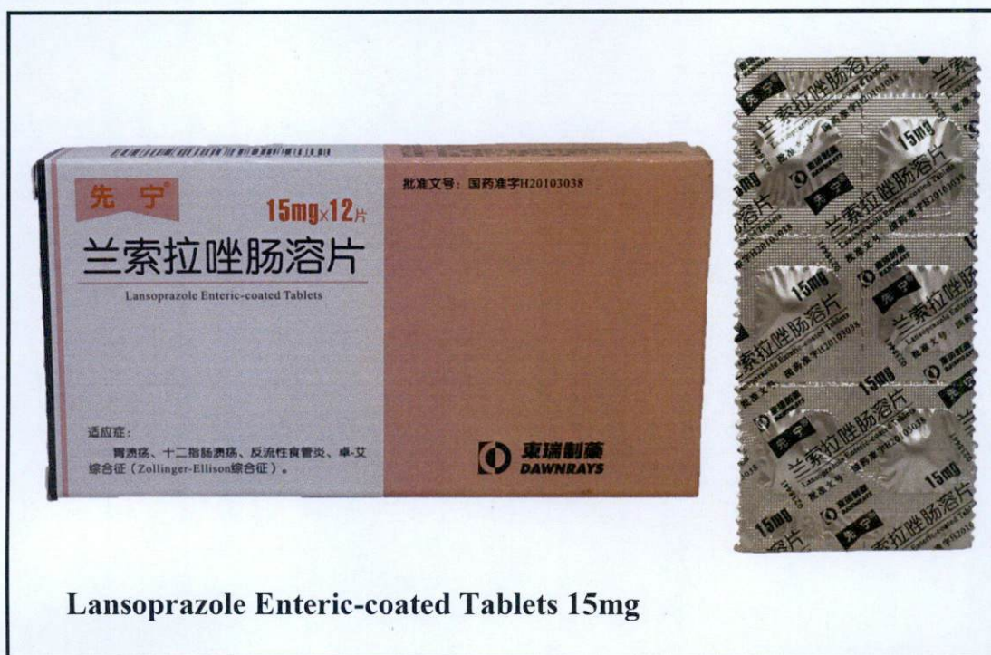
Lansoprazole Enteric-coated Tablets 15mg