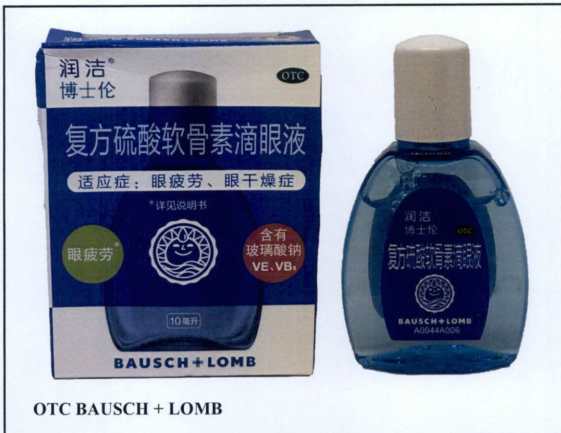
OTC BAUSCH + LOMB