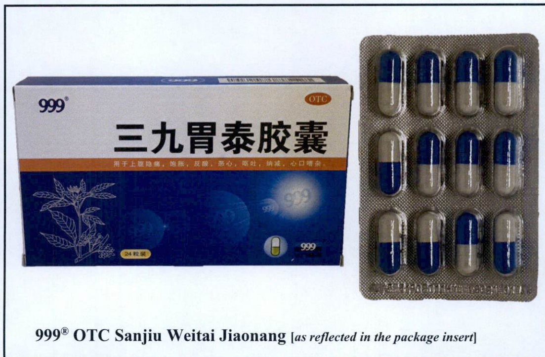
Larawan 3. Hindi rehistradong gamot