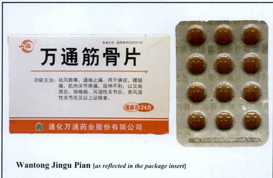
Wantong Jingu Pian [as reflected in the package insert]