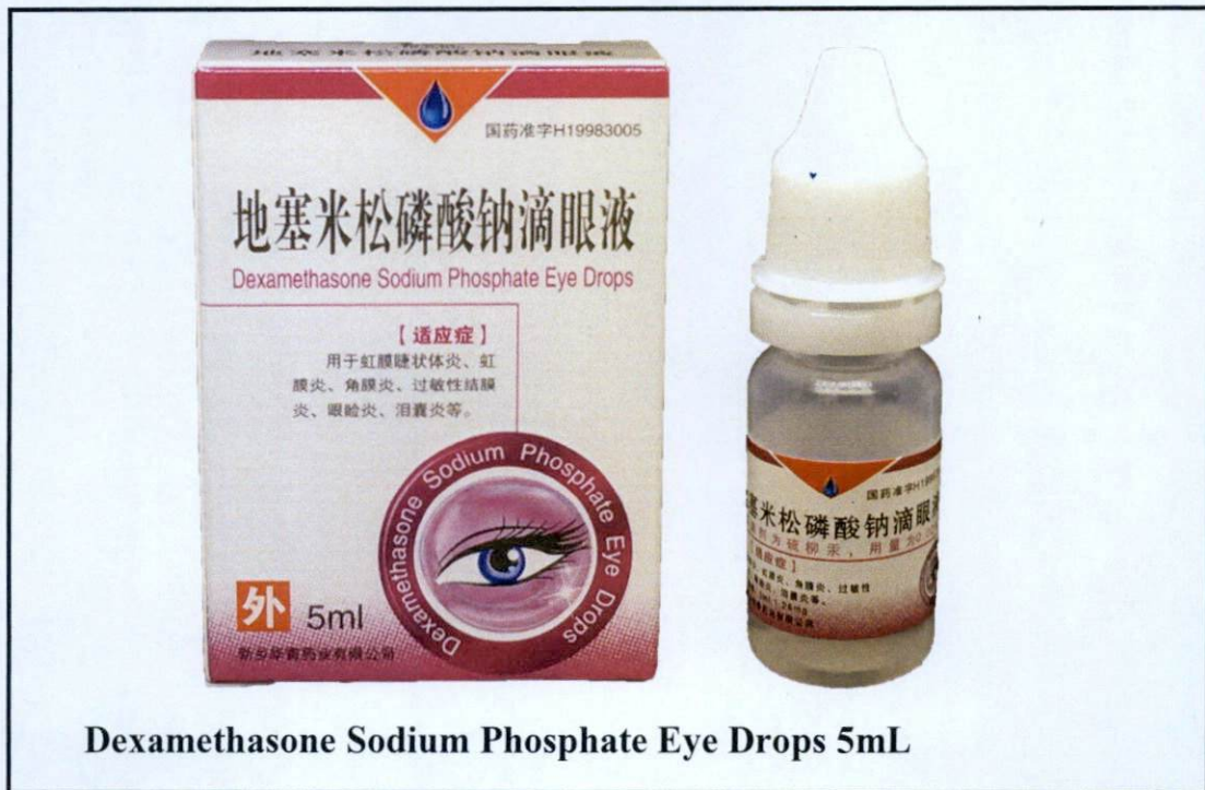
Larawan 5. Hindi rehistradong gamot