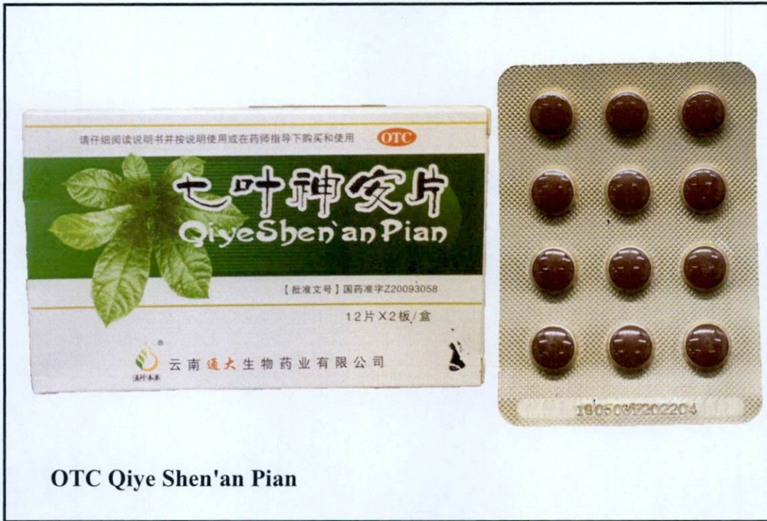
OTC Qiye Shen'an Pian