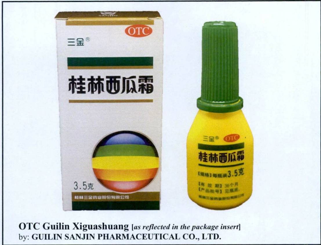
Larawan 4. Hindi rehistradong gamot