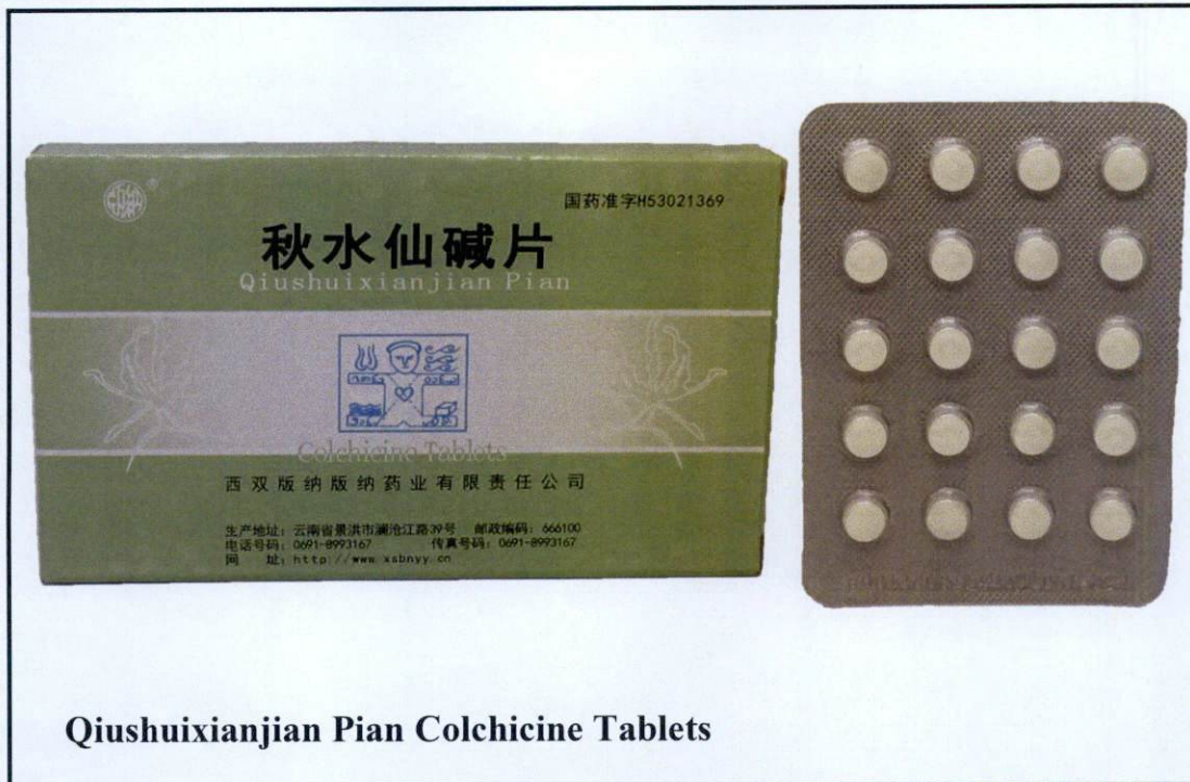
Qiushuixianjian Pian Colchicine Tablets