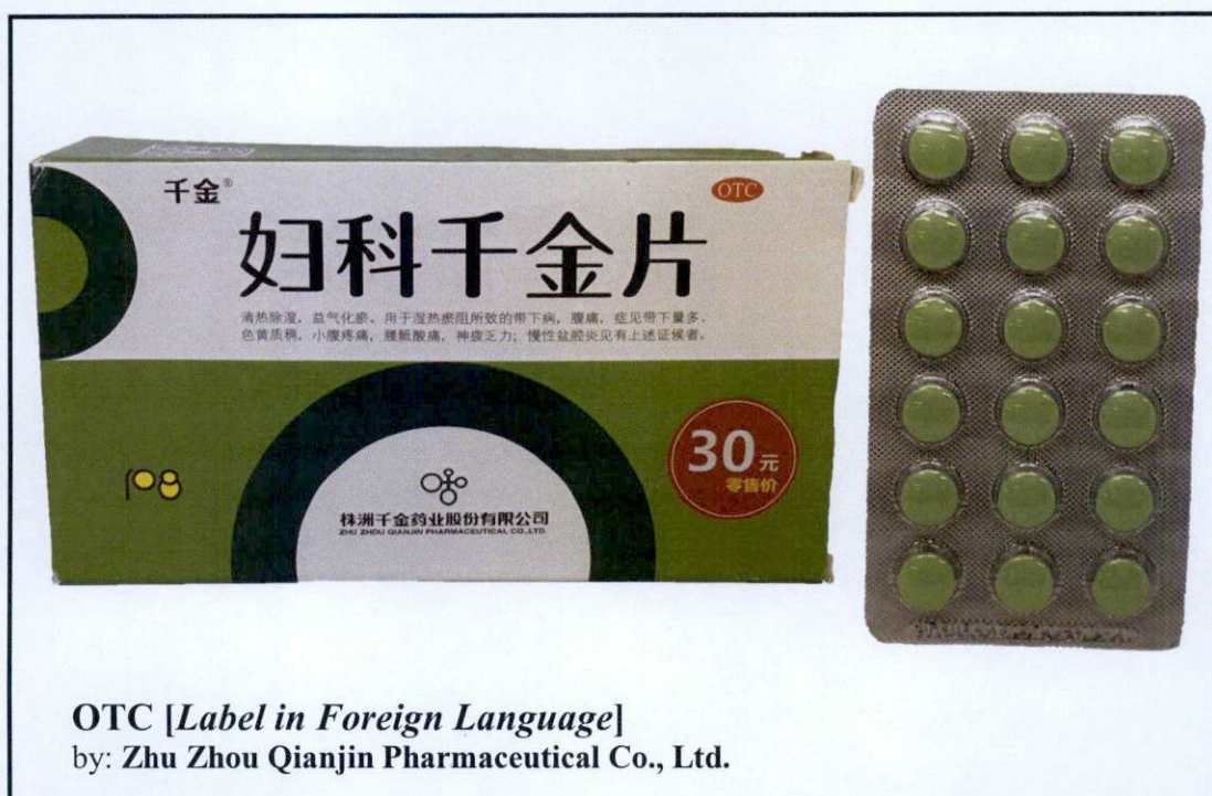
OTC [Label in Foreign Language] by: Zhu Zhou Qianjin Pharmaceutical Co., Ltd.