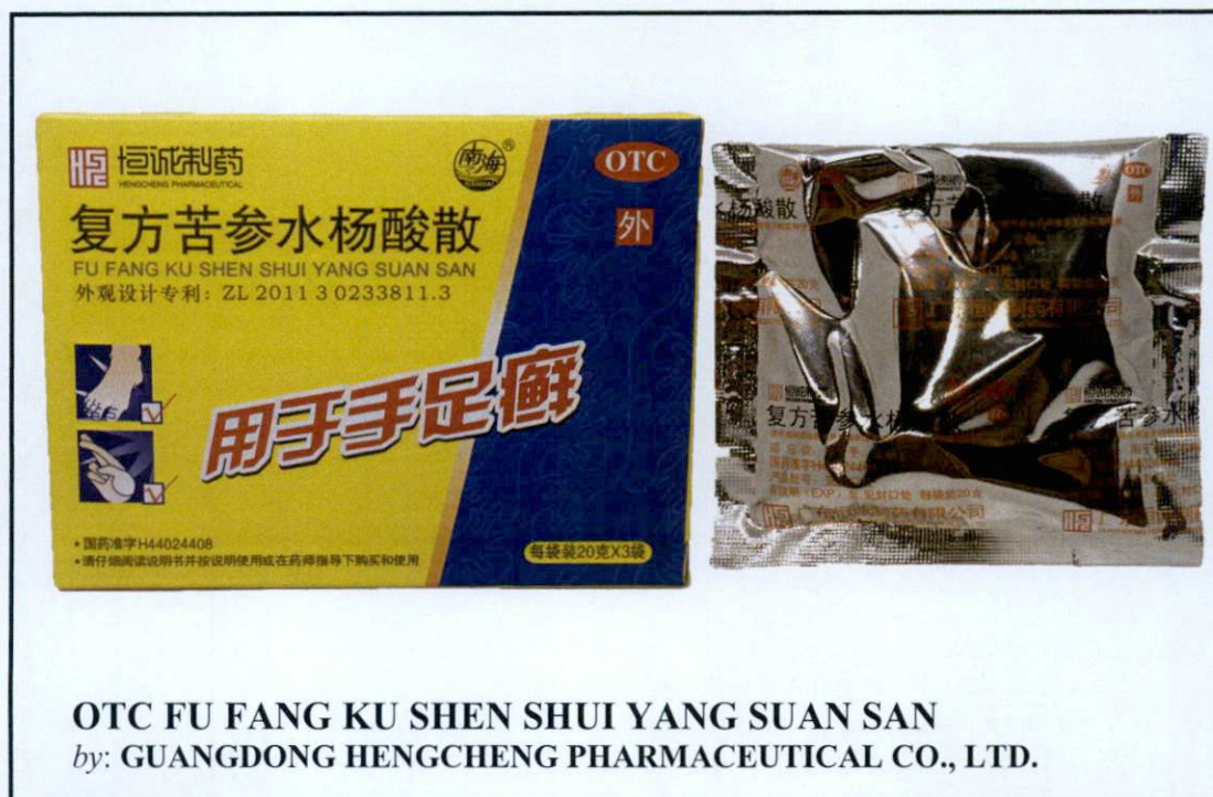
OTC FU FANG KU SHEN SHUI YANG SUAN SAN by: GUANGDONG HENGCHENG PHARMACEUTICAL CO., LTD.