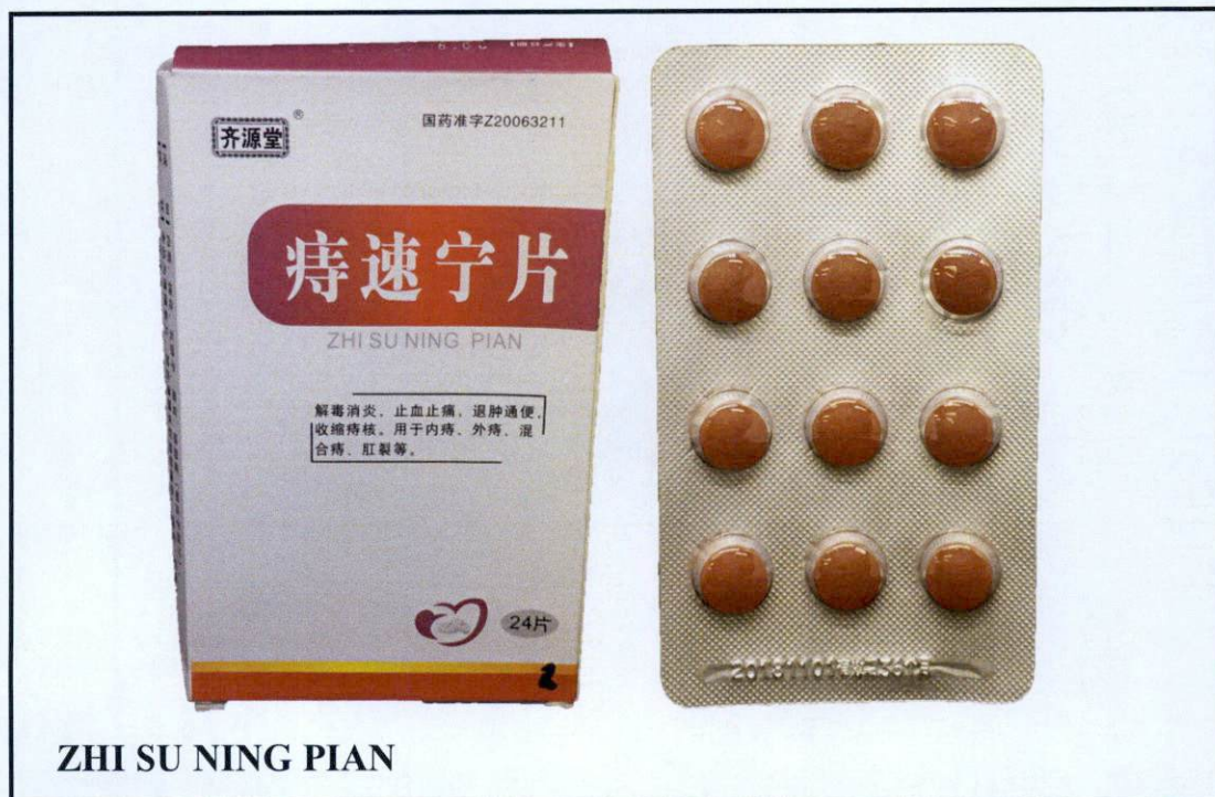
ZHI SU NING PIAN

Pinapayuhan ng Food and Drug Administration (FDA) ang publiko laban sa pagbili at paggamit ng mga hindi rehistradong gamot na: