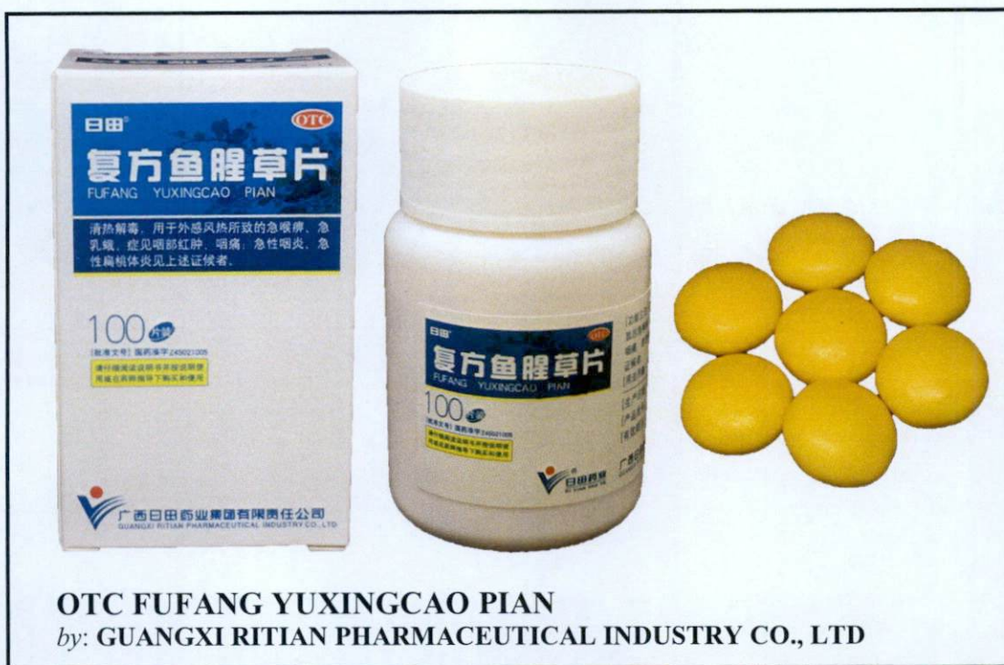
OTC FUFANG YUXINGCAO PIAN by: GUANGXI RITIAN PHARMACEUTICAL INDUSTRY CO., LTD