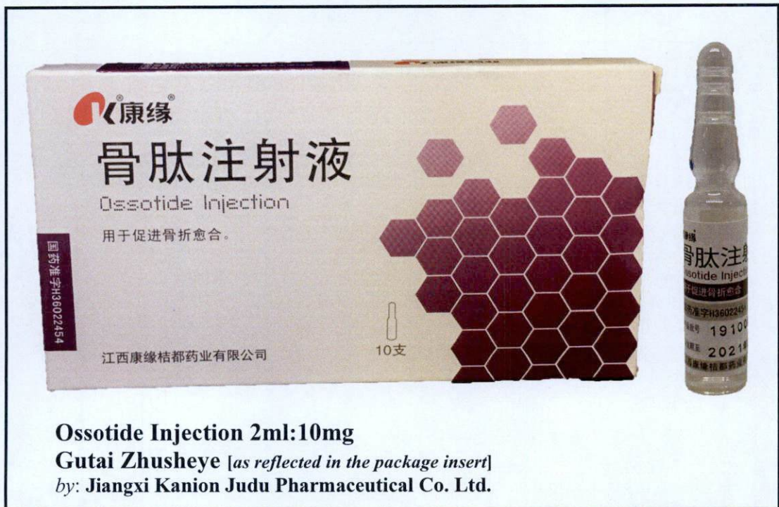
Larawan 5. Hindi rehistradong gamot