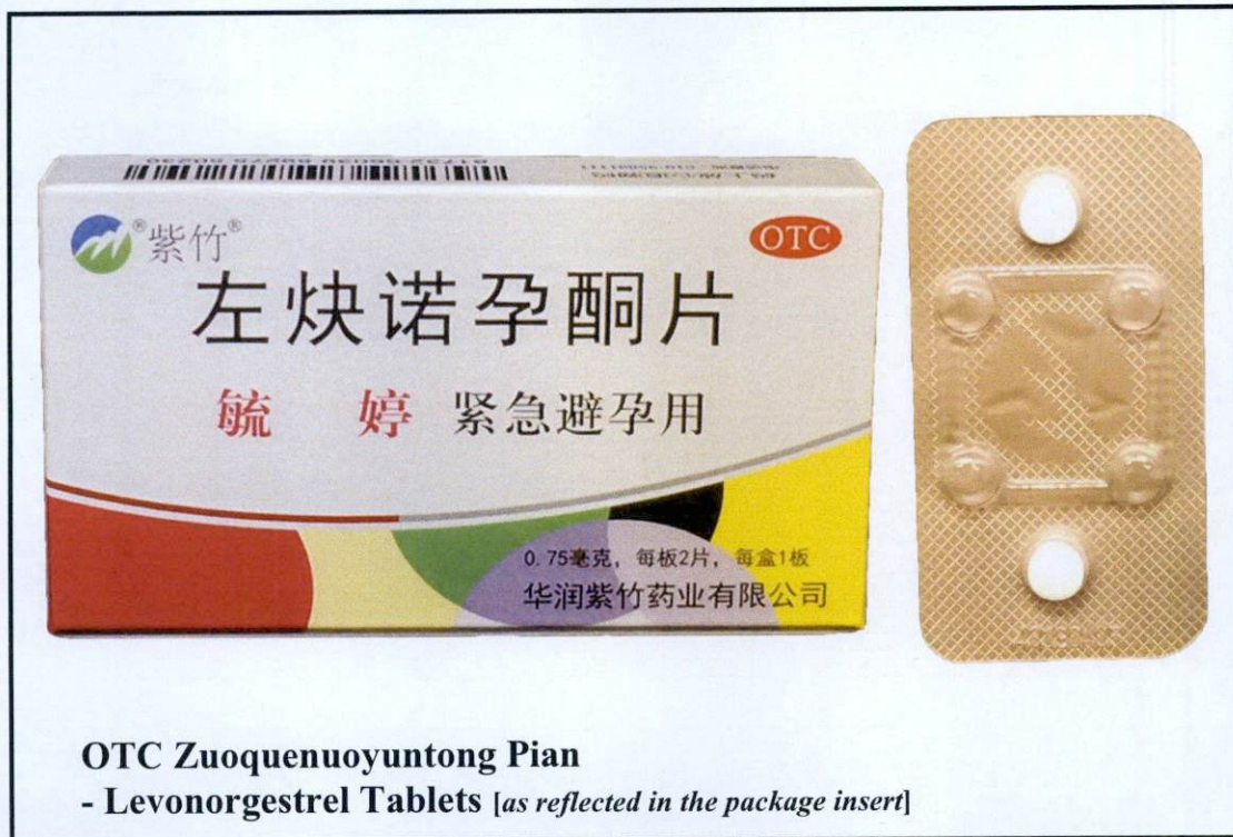
Larawan 2. Hindi rehistradong gamot