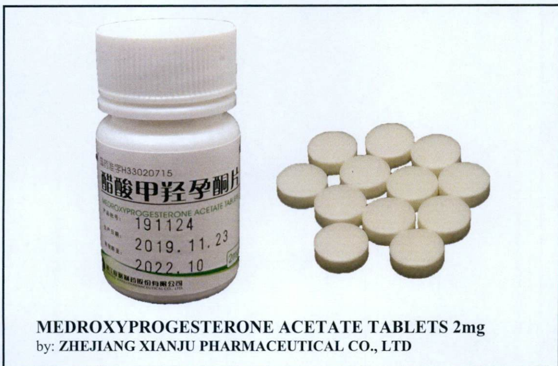
Larawan 5. Hindi rehistradong gamot