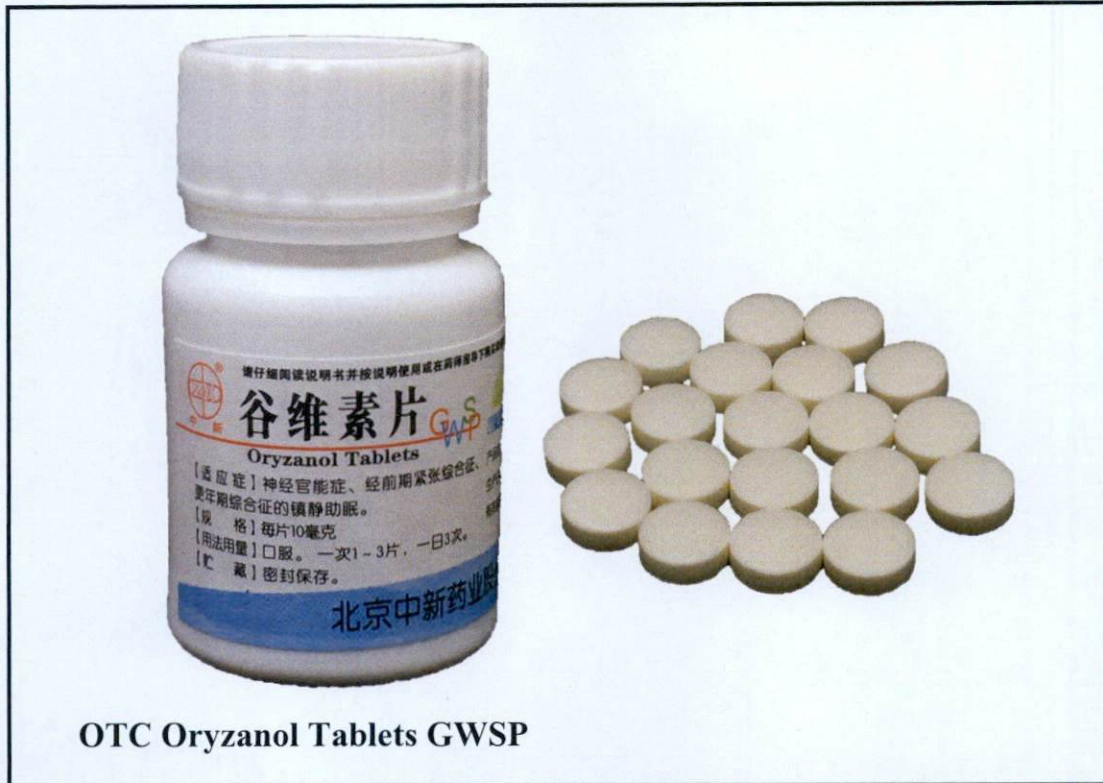
Larawan 4. Hindi rehistradong gamot