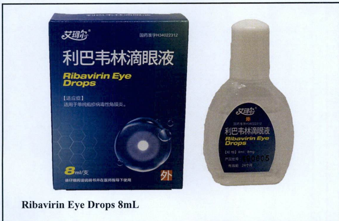
Larawan 3. Hindi rehistradong gamot