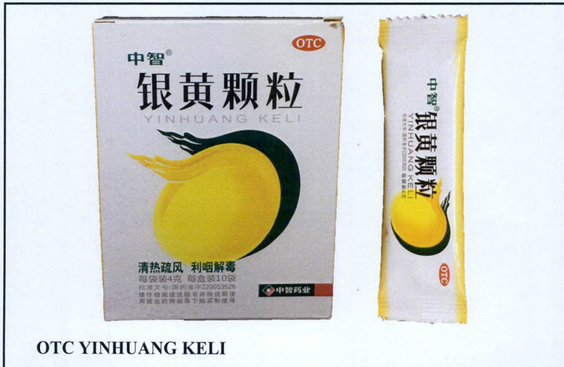
Larawan 1. Hindi rehiistradong gamot

Pinapayuhan ng Food and Drug Administration (FDA) ang publiko laban sa pagbili at paggamit ng mga hindi rehiistradong gamot na: