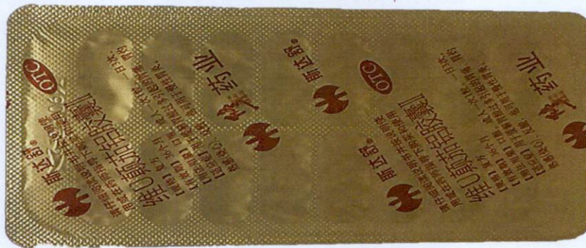
OTC Wei U Dianqie Lu Jiaonang II - Vitamin U, Belladonna and Aluminium Capsules II [as reflected in the package insert]