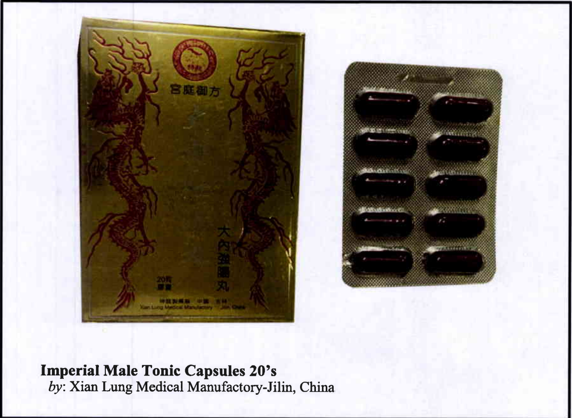
Imperial Male Tonic Capsules 20's by: Xian Lung Medical Manufactory-Jilin, China