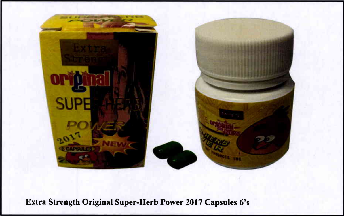
Extra Strength Original Super-Herb Power 2017 Capsules 6's