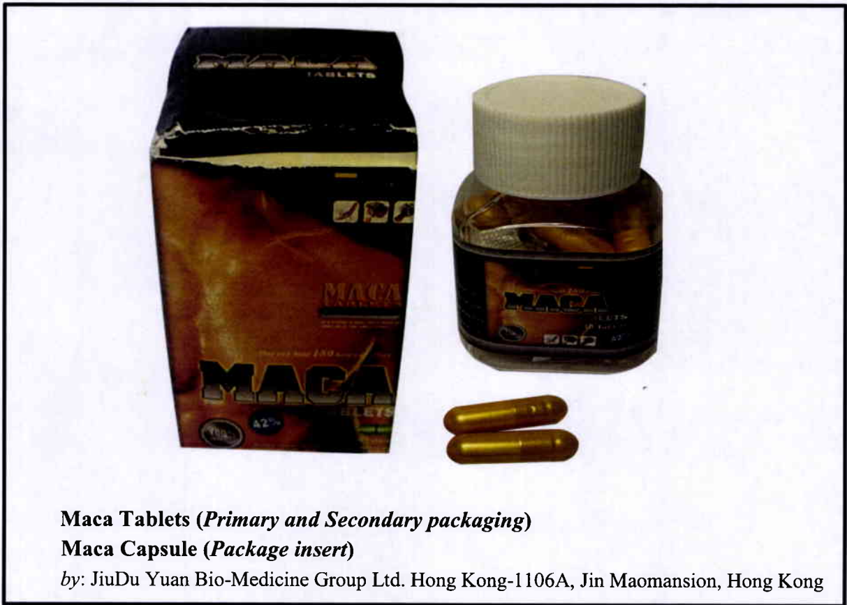
Larawan 2. Hindi rehistradong gamot