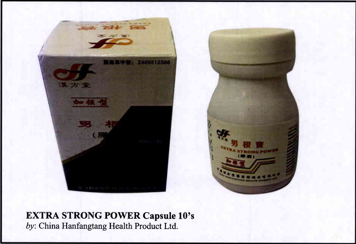
EXTRA STRONG POWER Capsule 10's by: China Hanfangtang Health Product Ltd.