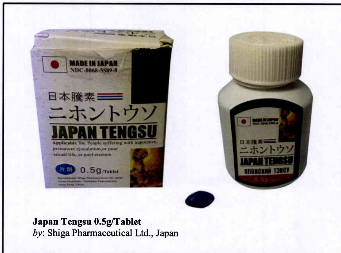
Larawan 1. Hindi rehistradong gamot

Pinapayuhan ng Food and Drug Administration (FDA) ang publiko laban sa pagbili at paggamit ng mga hindi rehistradong gamot na: