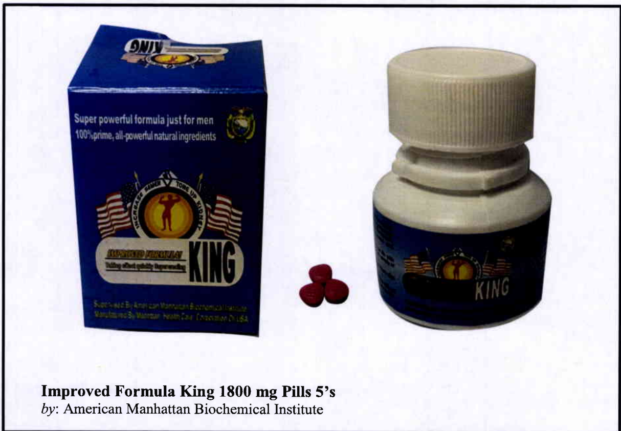
Larawan 3. Hindi rehistradong gamot