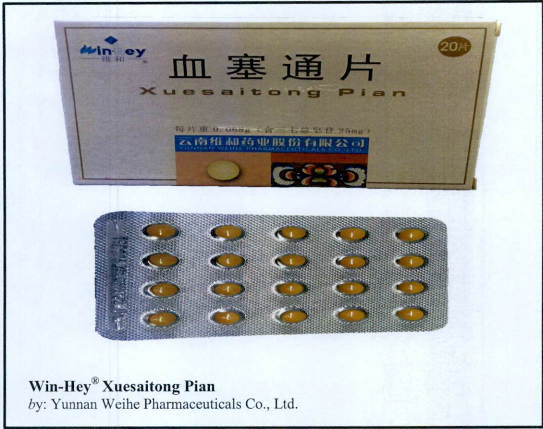
Win-Hey® Xuesaitong Pian by: Yunnan Weihe Pharmaceuticals Co., Ltd.