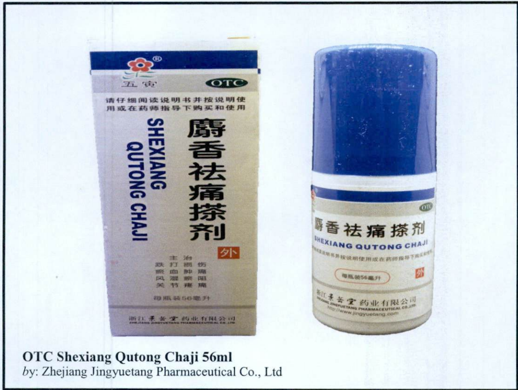
OTC Shexiang Qutong Chaji 56ml by: Zhejiang Jingyuetang Pharmaceutical Co., Ltd