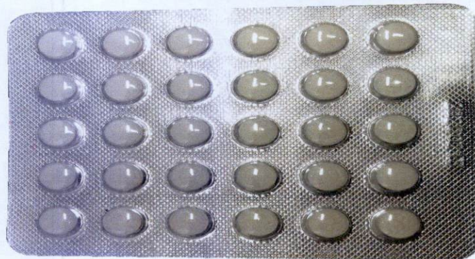
OTC Domperidone Tablets-Duopanlitong Pian (as reflected in the package insert) by: Shanxibaotai Pharmaceutical Co., Ltd.