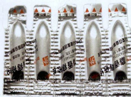
OTC She Xiang Zhi Chuang Shuan