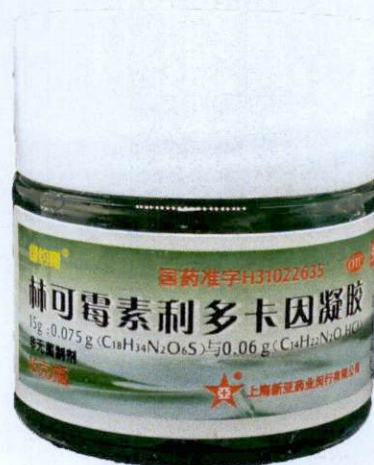
OTC Lincomycin Hydrochloride and Lidocaine Hydrochloride Gel