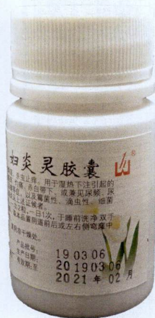
Fu Yan Ling Jiao Nang