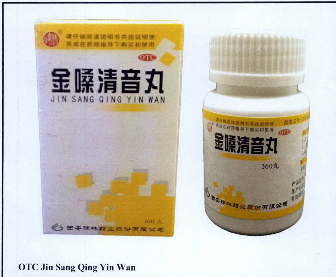
OTC Jin Sang Qing Yin Wan

Pinapayuhan ng Food and Drug Administration (FDA) ang publiko laban sa pagbili at paggamit ng mga hindi rehistradong gamot na: