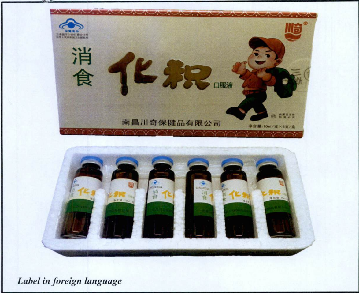
Larawan 2. Hindi rehistradong gamot