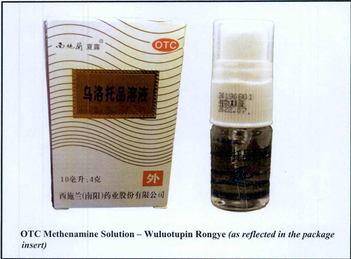
OTC Methenamine Solution – Wuluotopin Rongye (as reflected in the package insert)