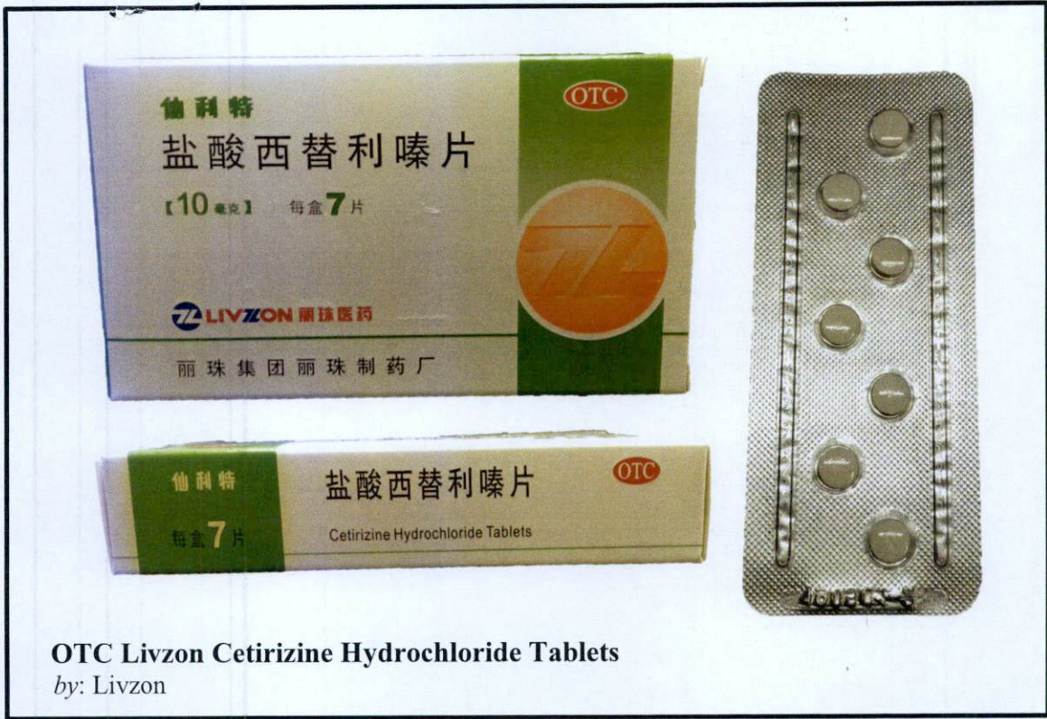
OTC Livzon Cetirizine Hydrochloride Tablets by: Livzon