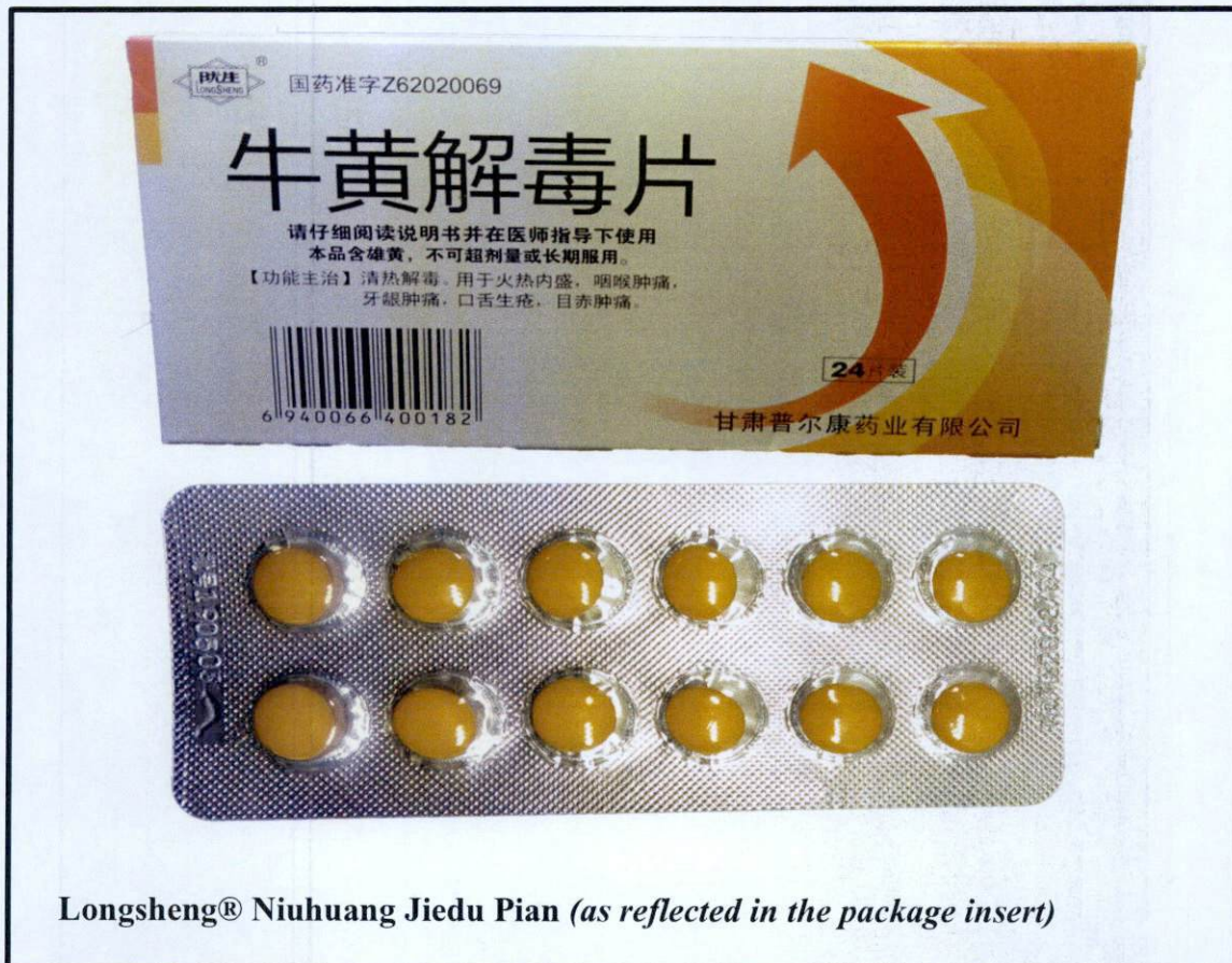
Longsheng® Niuhuang Jiedu Pian (as reflected in the package insert)

Pinapayuhan ng Food and Drug Administration (FDA) ang publiko laban sa pagbili at paggamit ng mga hindi rehistradong gamot na: