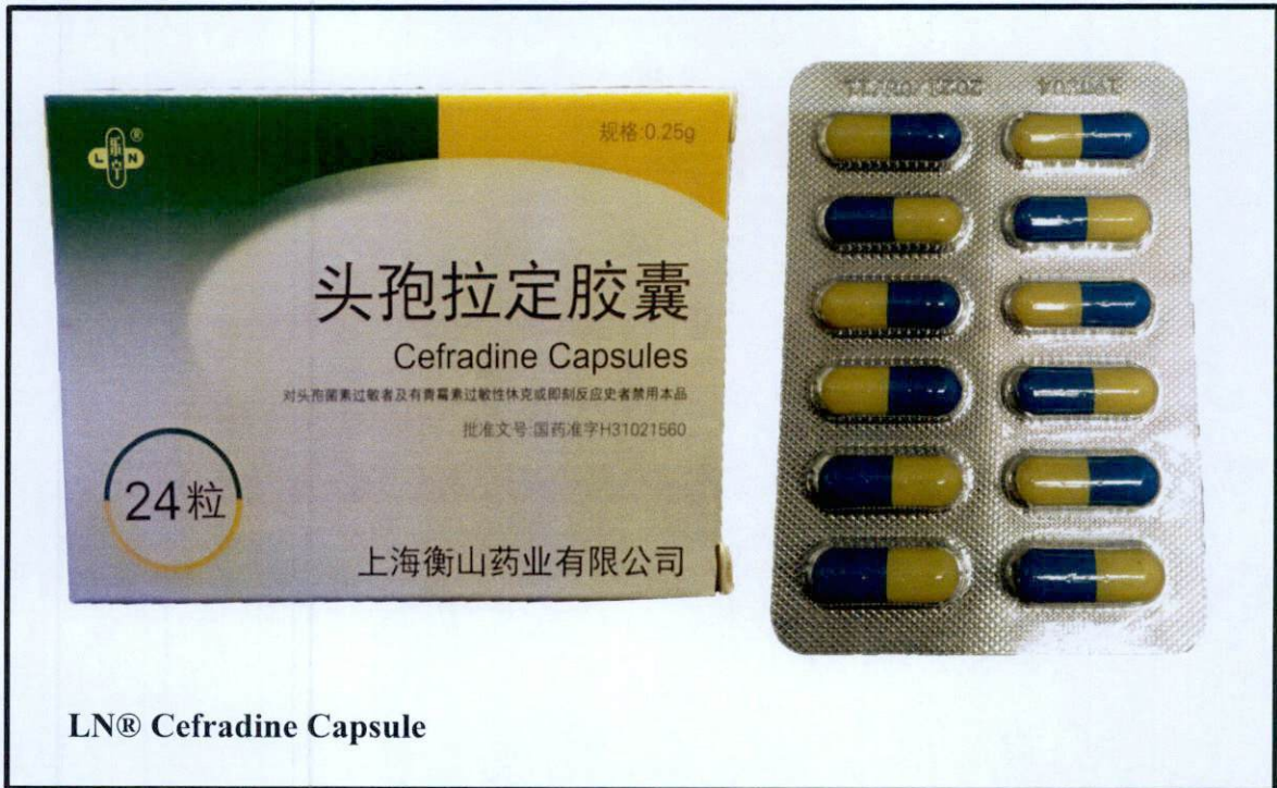
Larawan 3. Hindi rehistradong gamot