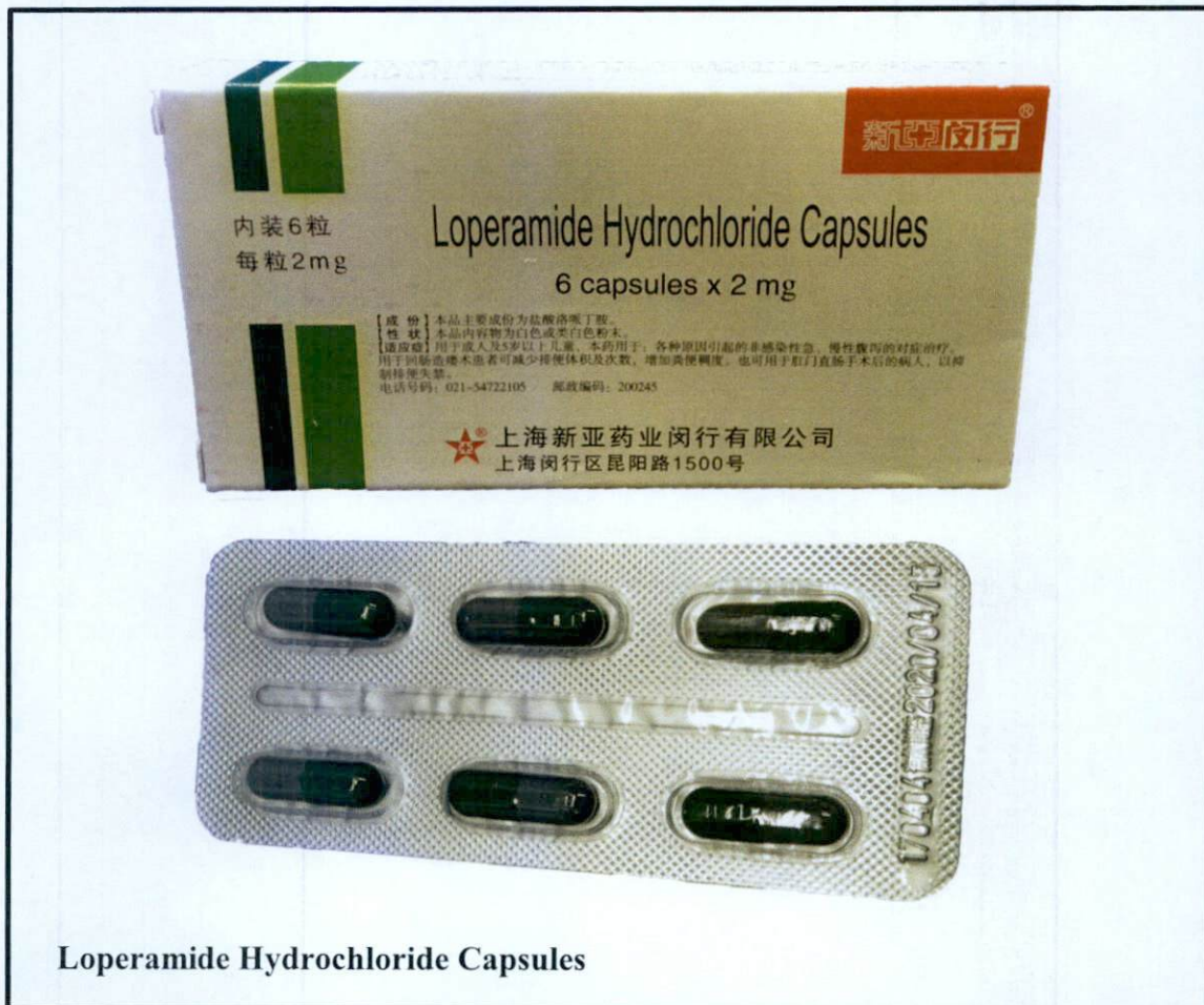
Loperamide Hydrochloride Capsules

Pinapayuhan ng Food and Drug Administration (FDA) ang publiko laban sa pagbili at paggamit ng mga hindi rehistradong gamot na: