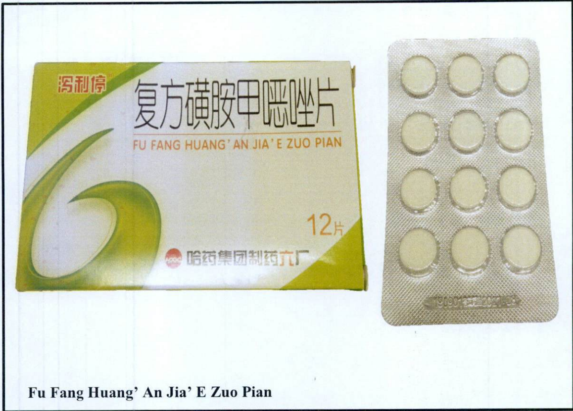
Fu Fang Huang' An Jia' E Zuo Pian