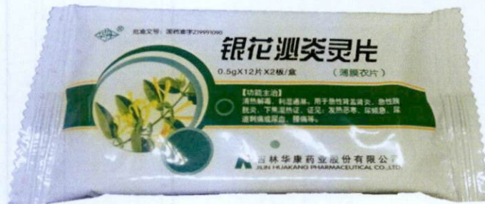
Yinhua Miyanling Pian (as reflected in the package insert) by: Jilin Huakang Pharmaceutical Co., Ltd.