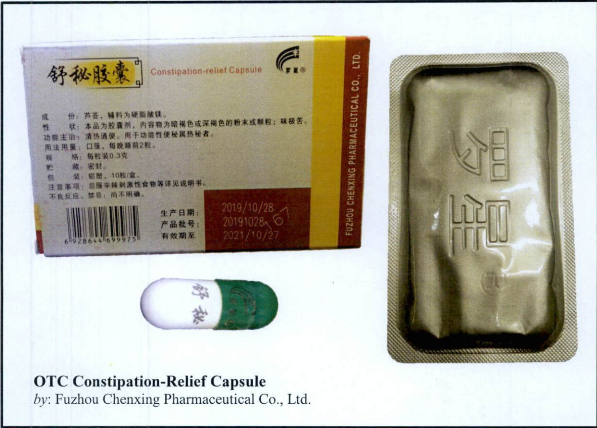
OTC Constipation-Relief Capsule by: Fuzhou Chenxing Pharmaceutical Co., Ltd.