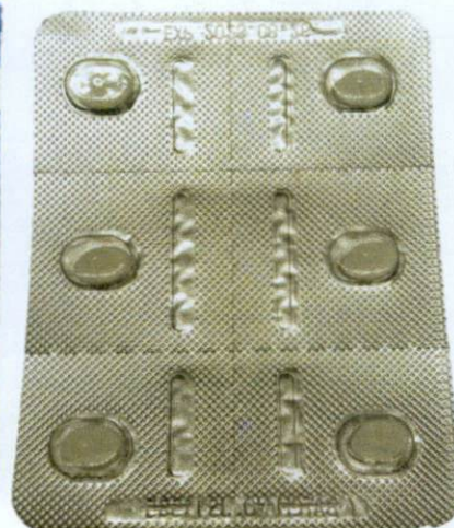
OTC Loratadine Tablets (Clarityne®)