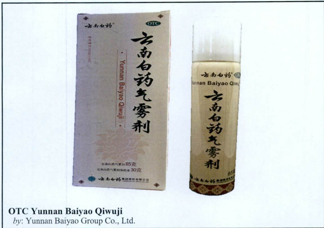
OTC Yunnan Baiyao Qiwuji by: Yunnan Baiyao Group Co., Ltd.