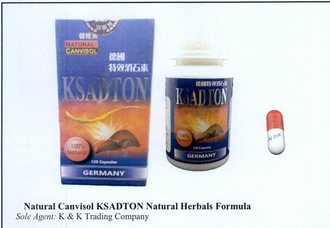
Natural Canvisol KSADTON Natural Herbals Formula Sole Agent: K & K Trading Company