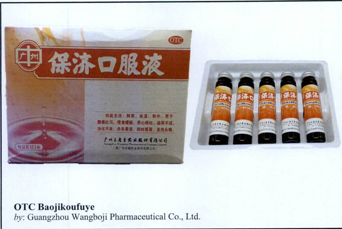
OTC Baojikoufuye by: Guangzhou Wangboji Pharmaceutical Co., Ltd.