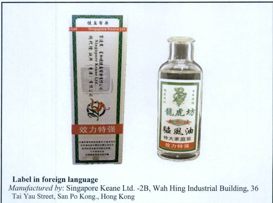
Label in foreign language Manufactured by: Singapore Keane Ltd. -2B, Wah Hing Industrial Building, 36 Tai Yau Street, San Po Kong., Hong Kong