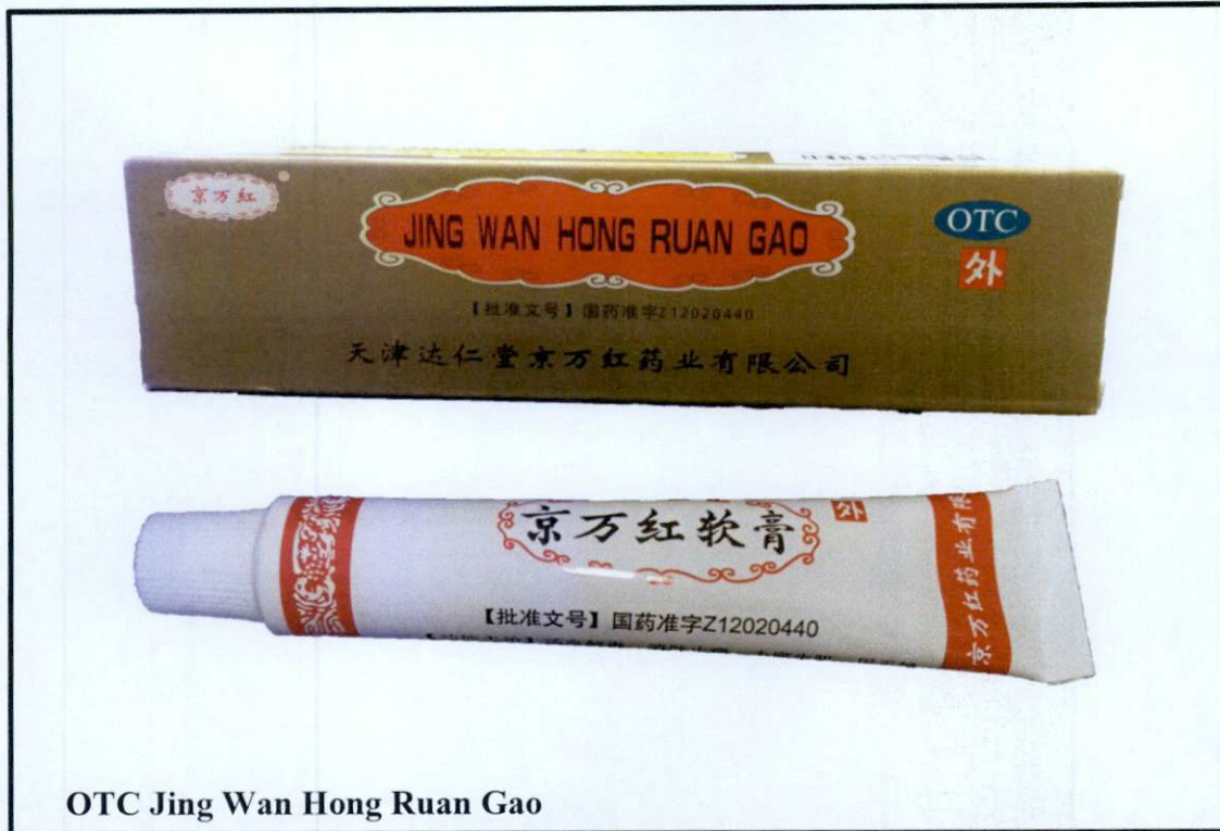
OTC Jing Wan Hong Ruan Gao