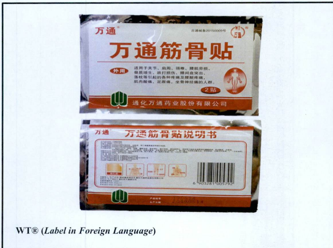
WT® (Label in Foreign Language)