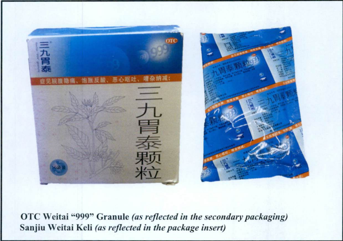
Larawan 4. Hindi rehistradong gamot

by Hong Kong Sole Agent : K & K Trading Company