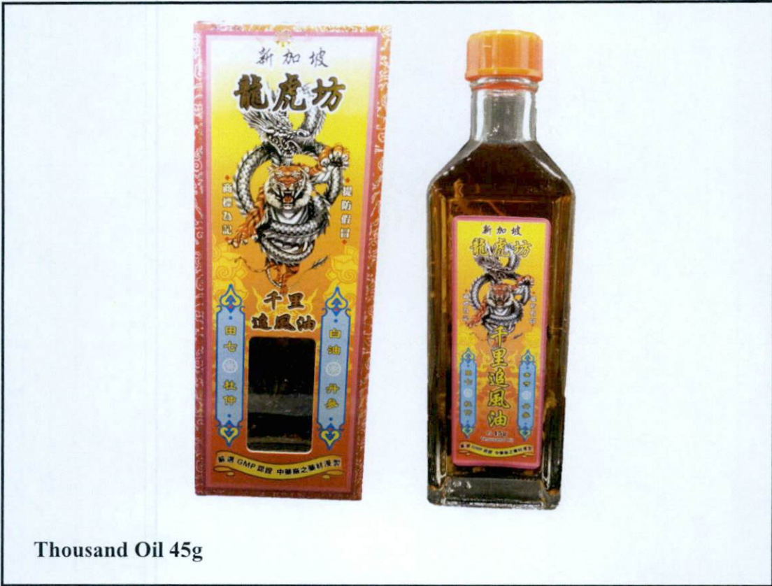
Thousand Oil 45g