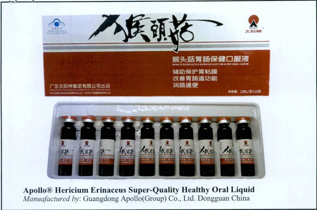
Figure 2. Unregistered drug product