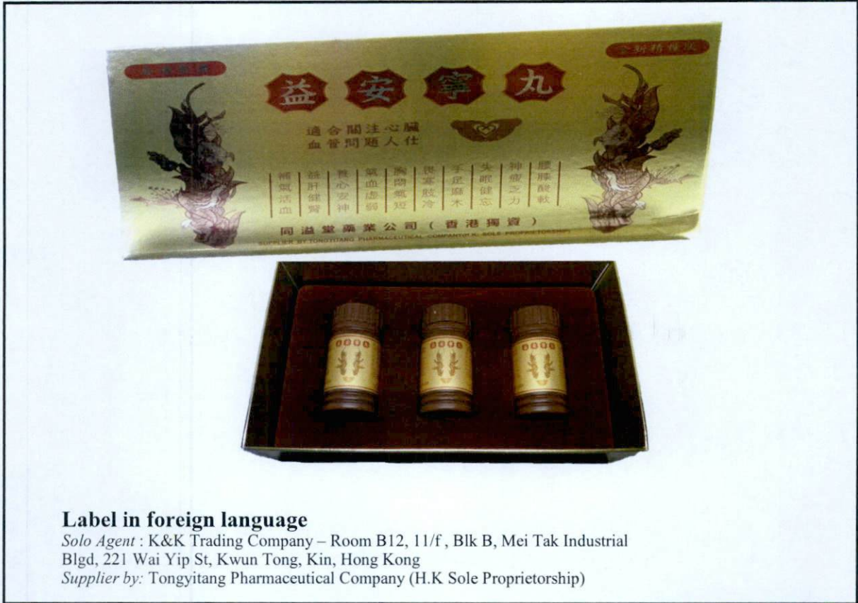
Figure 3. Unregistered drug product