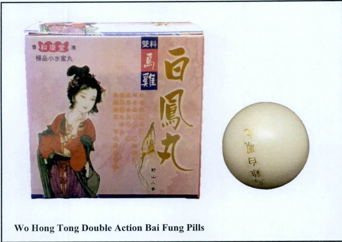
Wo Hong Tong Double Action Bai Fung Pills