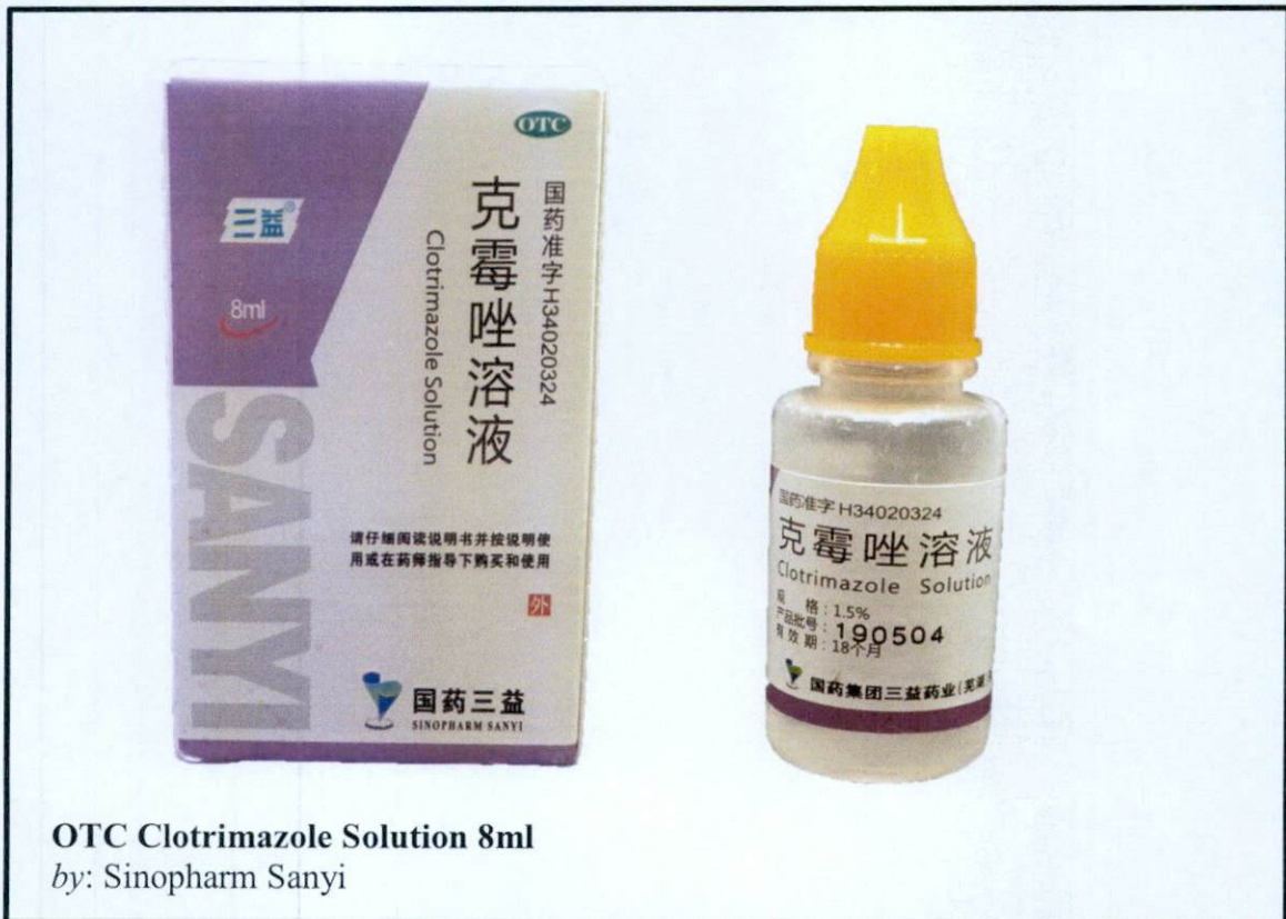
OTC Clotrimazole Solution 8ml by: Sinopharm Sanyi