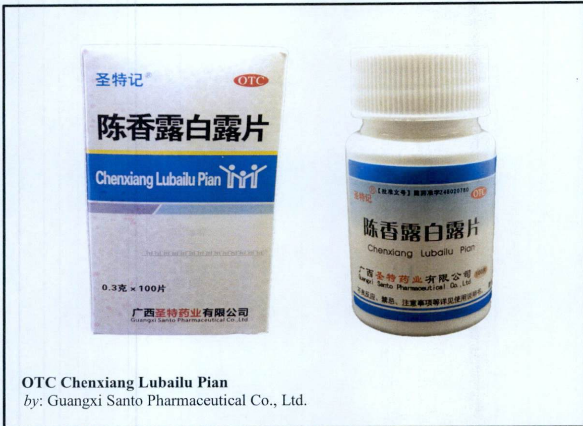
OTC Chenxiang Lubailu Pian by: Guangxi Santo Pharmaceutical Co., Ltd.