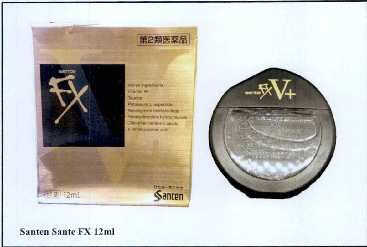
Santen Sante FX 12ml