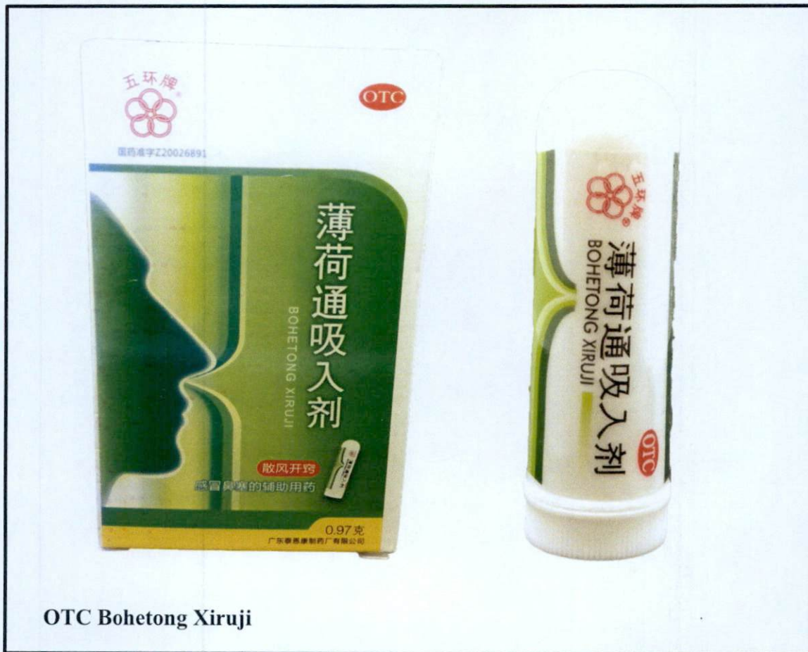
OTC Bohetong Xiruji

Pinapayuhan ng Food and Drug Administration (FDA) ang publiko laban sa pagbili at paggamit ng mga hindi rehistradong gamot na: