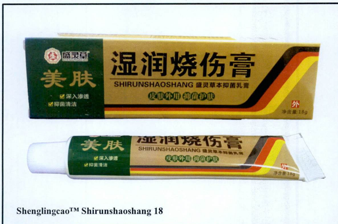
Shenglingcao™ Shirunshaoshang 18

Pinapayuhan ng Food and Drug Administration (FDA) ang publiko laban sa pagbili at paggamit ng mga hindi rehistradong gamot na: