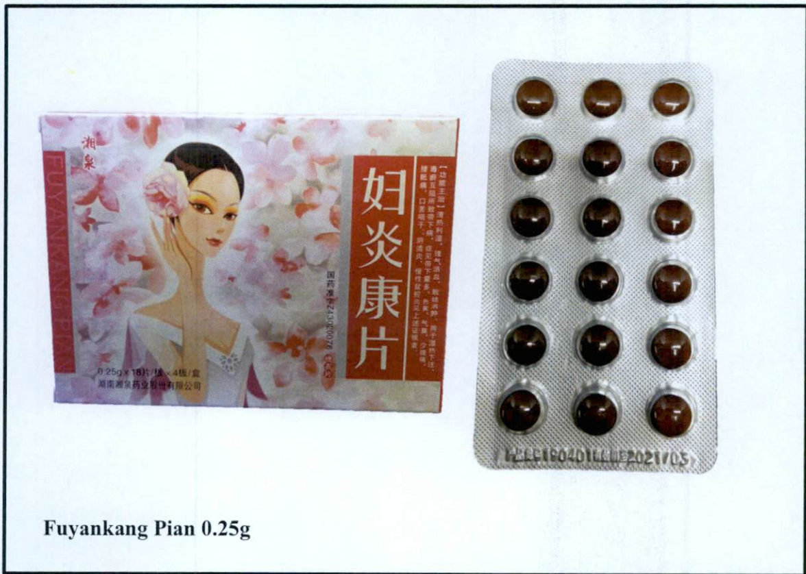
Larawan 3. Hindi rehistradong gamot