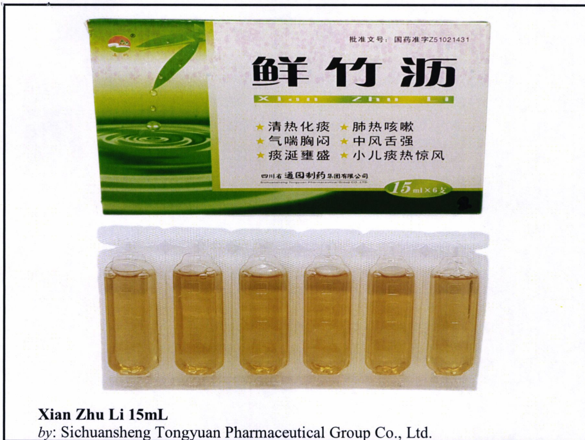
Xian Zhu Li 15mL

by: Sichuansheng Tongyuan Pharmaceutical Group Co., Ltd.