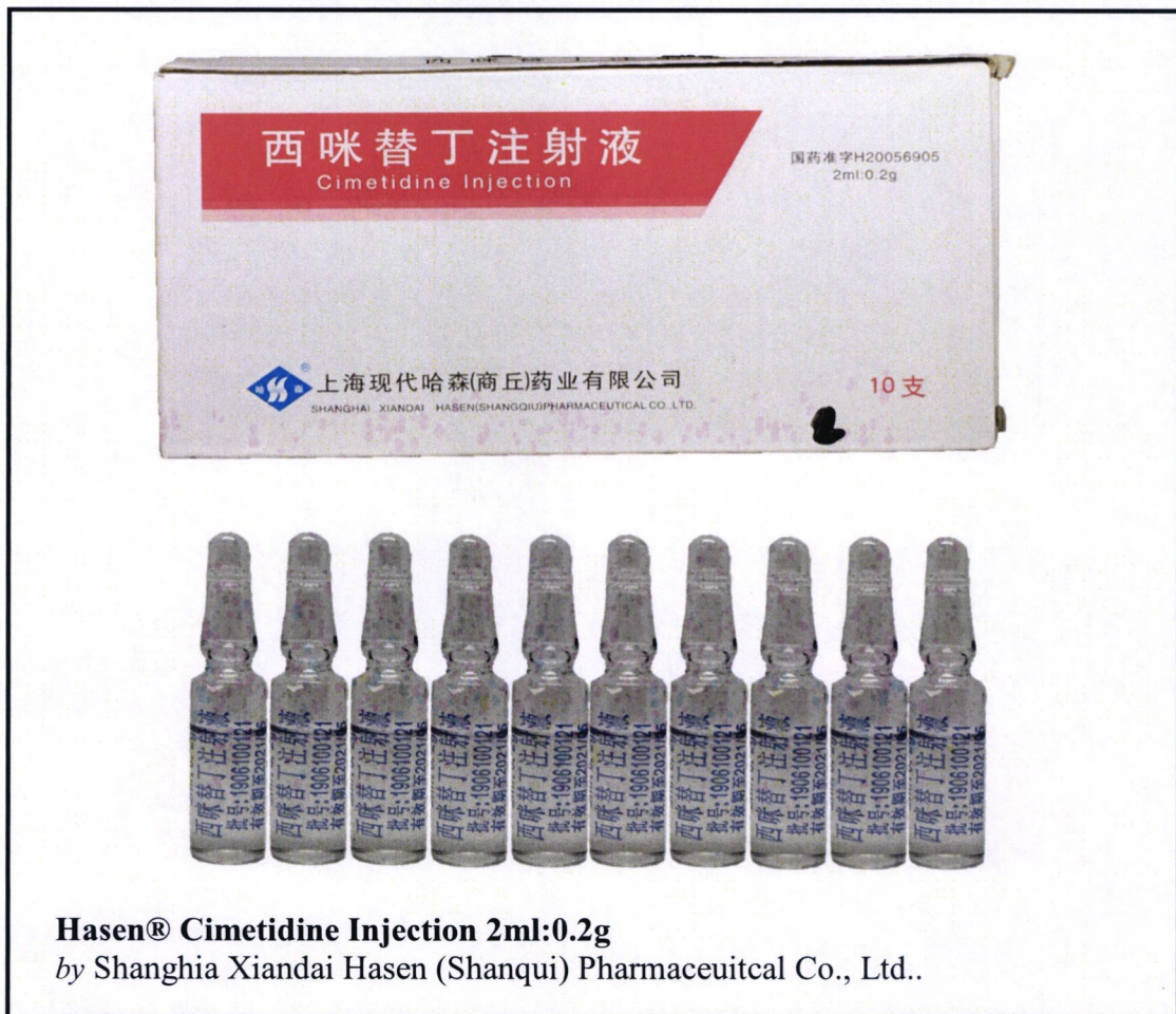
Larawan 5. Hindi rehistradong gamot