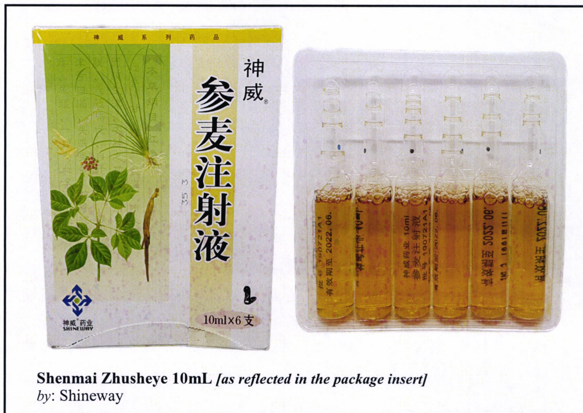
Shenmai Zhusheye 10mL [as reflected in the package insert]