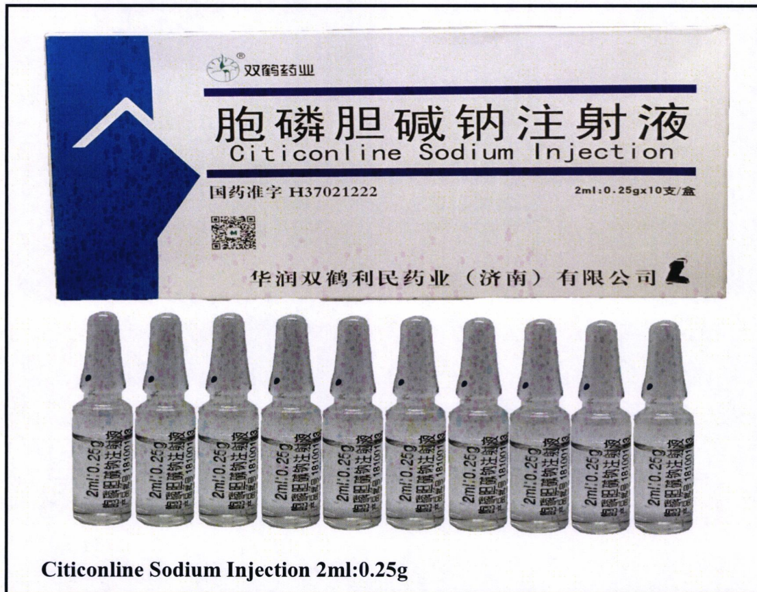
Citiconline Sodium Injection 2ml:0.25g

Pinapayuhan ng Food and Drug Administration (FDA) ang publiko laban sa pagbili at paggamit ng mga hindi rehistradong gamot na: