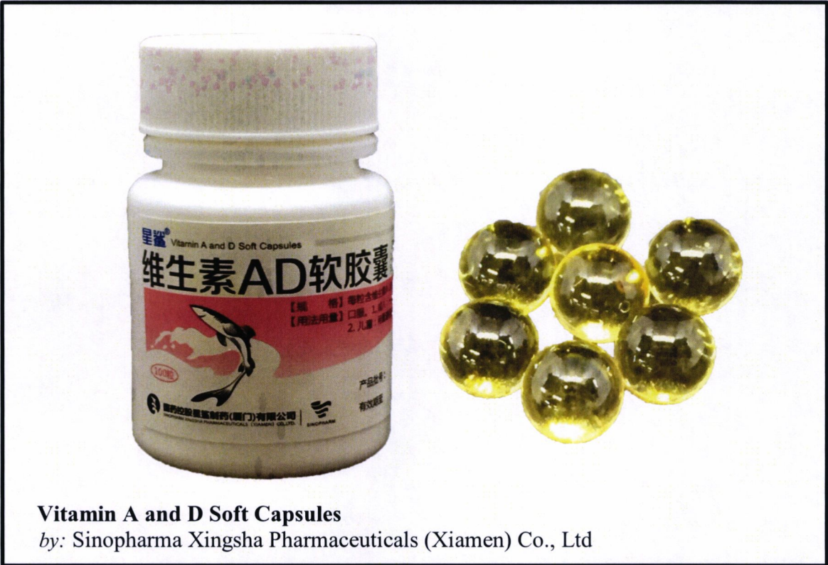
Vitamin A and D Soft Capsules by: Sinopharma Xingsha Pharmaceuticals (Xiamen) Co., Ltd