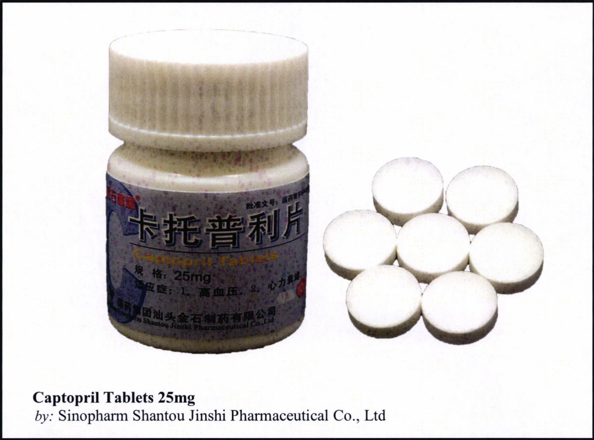
Captopril Tablets 25mg by: Sinopharm Shantou Jinshi Pharmaceutical Co., Ltd