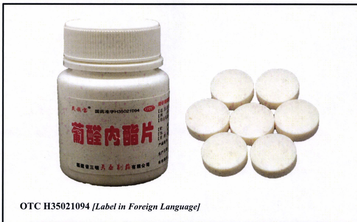
OTC H35021094 [Label in Foreign Language]