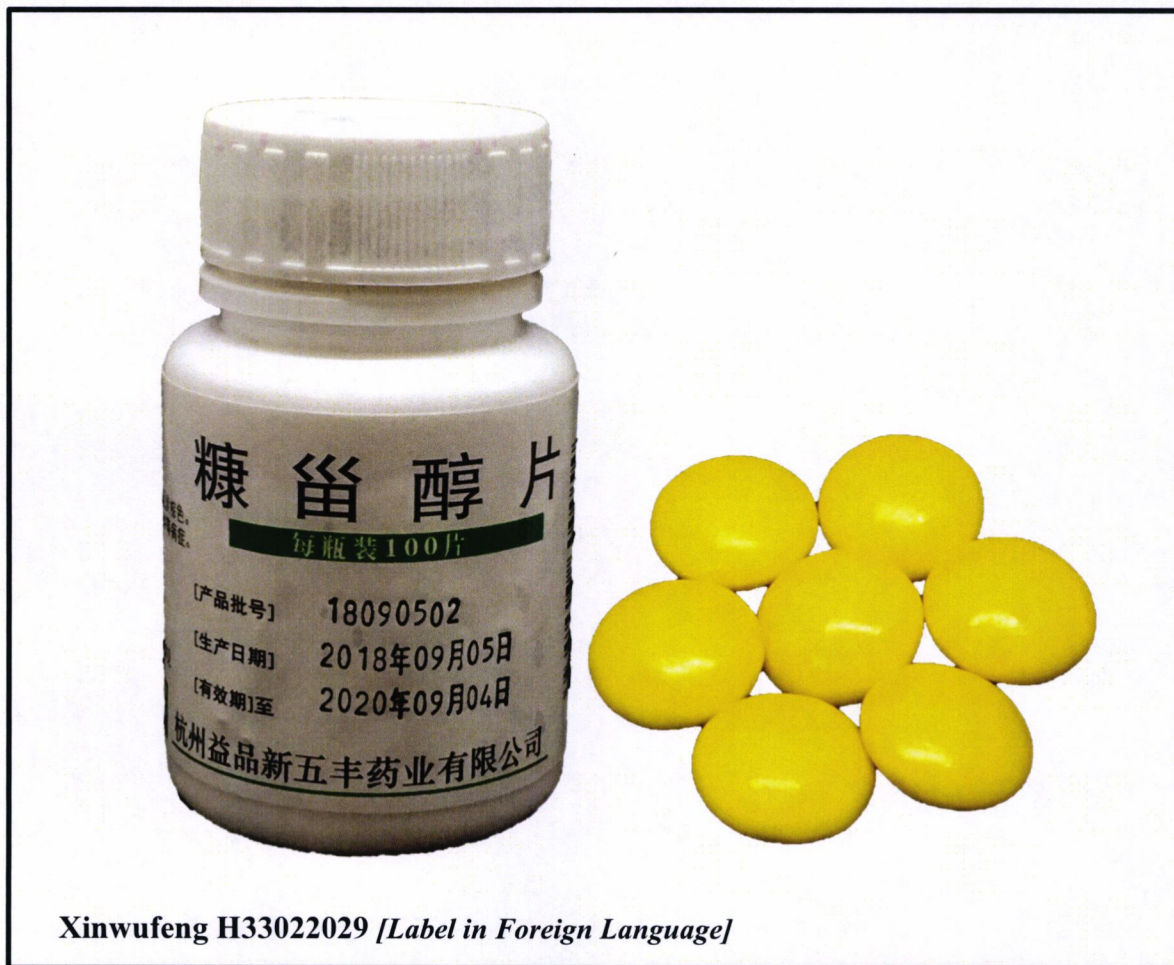
Xinwufeng H33022029 [Label in Foreign Language]