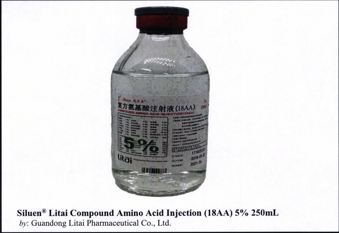
Siluen® Litai Compound Amino Acid Injection (18AA) 5% 250mL by: Guandong Litai Pharmaceutical Co., Ltd.