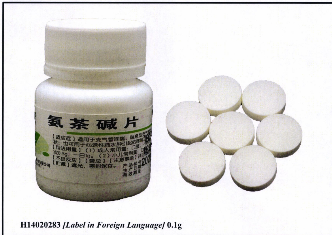
H14020283 [Label in Foreign Language] 0.1g

Pinapayuhan ng Food and Drug Administration (FDA) ang publiko laban sa pagbili at paggamit ng mga hindi rehistradong gamot na: