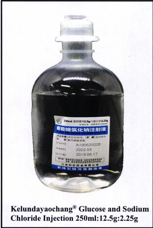
Kelundayaochang® Glucose and Sodium Chloride Injection 250ml:12.5g:2.25g