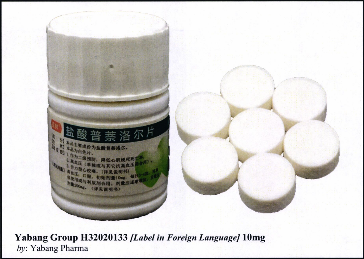
Yabang Group H32020133 [Label in Foreign Language] 10mg by: Yabang Pharma