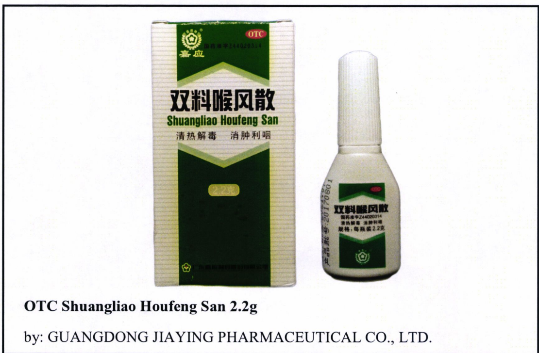
Larawan 5. Hindi rehistradong gamot