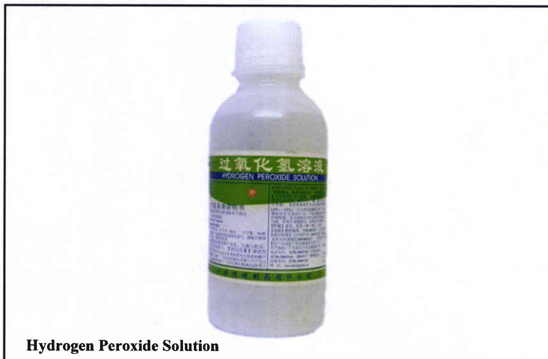
Hydrogen Peroxide Solution

Pinapayuhan ng Food and Drug Administration (FDA) ang publiko laban sa pagbili at paggamit ng mga hindi rehistradong gamot na: